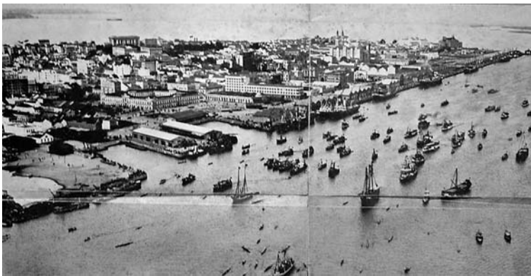
Fotografia 16

Se algumas imagens isolam o objeto fotografado, subtraindo-o do con-