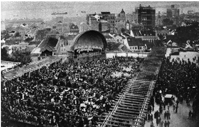
Fotografia 10 – Auditorium Araújo Viana (todo de concreto armado). Local onde se realizam [sic] concertos públicos pela Banda Municipal. (legenda original)

A imagem da Praça Marechal Deodoro, tendo em destaque o Auditório Araújo Viana (fotografia 10), é elucidativa a esse respeito, apresentando vários aspectos a considerar. Não são algumas pessoas dispersas pelo espaço urbano que são mostradas, mas dezenas de espectadores reunidos por ocasião de uma apresentação da Banda Municipal. Essa imagem, assim, torna evidente um personagem que surge com o advento das metrópoles e da própria modernidade, a multidão, tão bem descrita por Edgar Allan Poe em seu célebre conto “O homem da multidão”. 28 Assim, em termos visuais essa imagem foto-