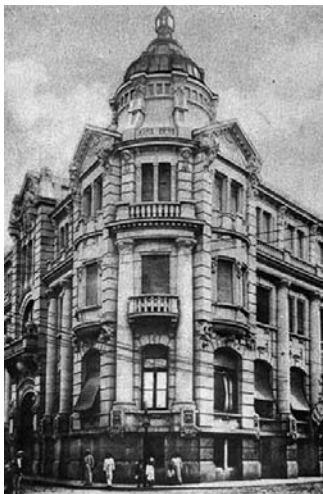
Fotografia 3 – Banco da Província do Rio Grande do Sul – Tradicional estabelecimento Bancário riograndense (sic). (legenda original)