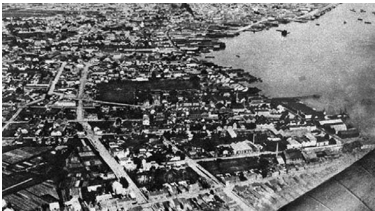
Fotografia 4 – Vista aérea de uma parte de Porto Alegre. (legenda original).

As vistas aéreas presentes em Porto Alegre Álbum reforçam essa interpretação. Nesse álbum estão presentes três vistas aéreas: a primeira está disposta na página ao lado da imagem vertical da edificação do Banco da Província e tem como objeto a ponta do promontório e a orla que contorna a área central em direção à Zona Norte, onde se localizavam os bairros industriais (fotografia 4); a segunda é uma tomada da Praça Marechal Deodoro (fotografia 7), que