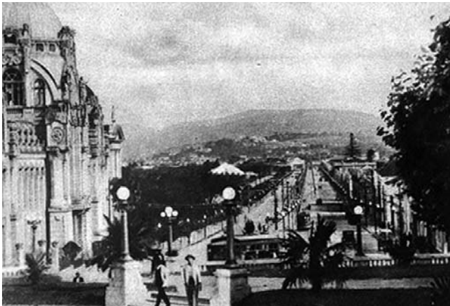
Fotografia 11 – Avenida João Pessoa – Comprimento 2.200 metros – Largura 46 metros – Toda pavimentada de concreto armado. (legenda original)

Porto Alegre Álbum apresenta duas vistas noturnas dispostas isoladamente, ambas de autoria do estúdio Azevedo e Dutra. A imagem da Avenida João