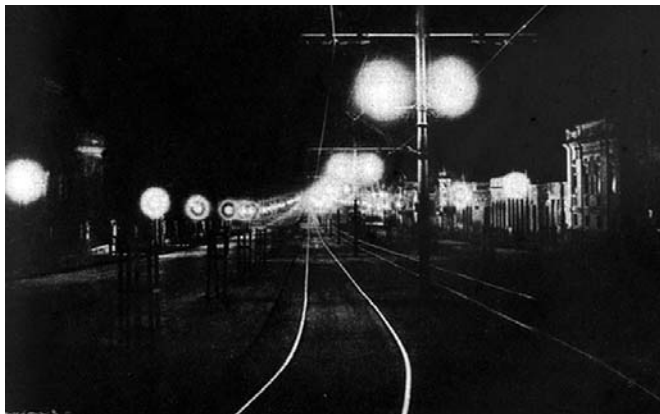
Fotografia 12 – Avenida João Pessoa, vista tomada pela madrugada. (legenda original)

Pessoa é seguida por uma imagem também noturna da Rua dos Andradas (fotografia 13). Nas duas imagens as vias fotografadas apresentam características que dão uma feição misteriosa à cidade. Ambas apresentam alto contraste com a penumbra tomando grande proporção do quadro. Na escuridão das ruas podemos observar apenas os traços das edificações e postes de iluminação, calçadas, automóveis ou equipamentos urbanos. Praticamente toda a su-