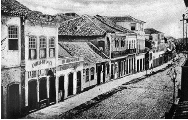
Fotografia 8 – Rua dos Andradas, em 1870. (legenda original)