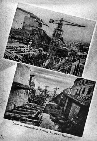
Fotografia 14 e 15 – Obras da Construção da Avenida Borges de Medeiros. (legenda original)

O paradoxo, no entanto, esboroa-se no momento em que percebo que essas imagens de obras viárias, que expõem o corpo da cidade de forma tão ‘desrespeitosa’, exibem o trabalho sobre o corpo de uma cidade revolvida por pás e picaretas e de cujo processo de transformação deverá surgir uma nova cidade de fisionomia almejada pelos produtores da edição.