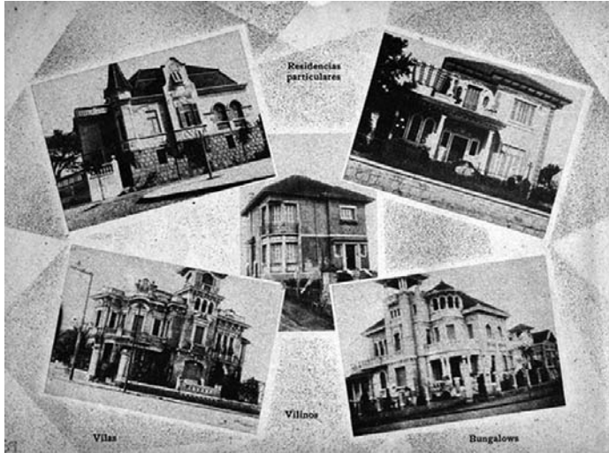
Fotografia 17 a 20 – Residências particulares. Vilas, Vilinos, Bungalows (legenda original).

mente dos conjuntos anteriormente mencionados, neste caso, uma imagem isolada está associada a outras três imagens agrupadas em página ao lado, mostrando pontos de vista diferenciados do motivo focado.