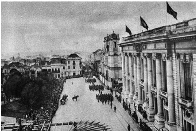
Fotografia 2 – Palácio do Governo – Ao lado, a antiga catedral, hoje demolida, erguendo-se, atualmente, em seu lugar, o majestoso monumento que será a futura catedral. (legenda original)