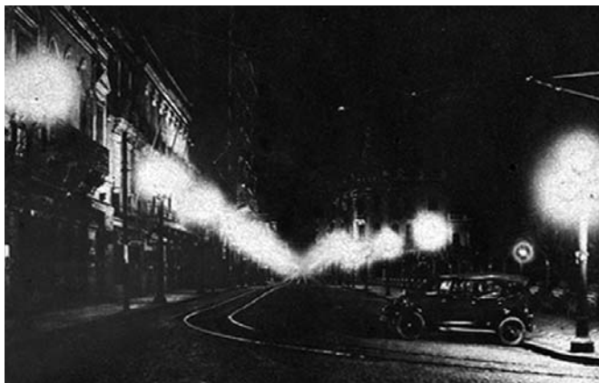
Fotografia 13 – Rua dos Andradas, vista tomada pela madrugada. (legenda original)

Pessoa é seguida por uma imagem também noturna da Rua dos Andradas (fotografia 13). Nas duas imagens as vias fotografadas apresentam características que dão uma feição misteriosa à cidade. Ambas apresentam alto contraste com a penumbra tomando grande proporção do quadro. Na escuridão das ruas podemos observar apenas os traços das edificações e postes de iluminação, calçadas, automóveis ou equipamentos urbanos. Praticamente toda a su-