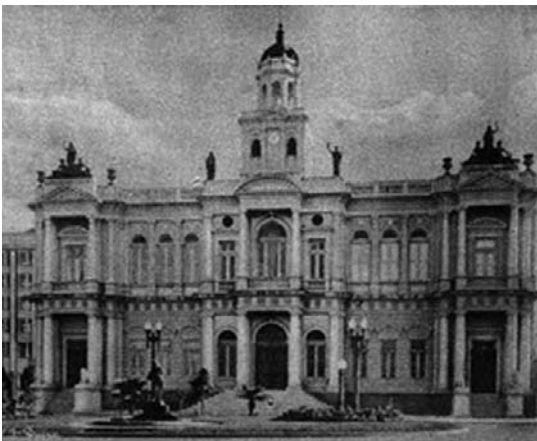
Fotografia 1 – Prefeitura Municipal de Porto Alegre. (legenda original)

A primeira página visual do álbum traz, à direita, a imagem de uma edificação imponente, a Prefeitura Municipal (fotografia 1) e, à esquerda, o retrato em formato oval e em perfil do prefeito Alberto Bins. Na página ao lado, uma imagem da Praça Marechal Deodoro e do Palácio do Governo, tendo ao seu lado a Igreja Matriz (fotografia 2). Eu poderia mencionar apenas as estruturas materiais presentes nessas imagens, mas, em frente ao Palácio do Governo há uma aglomeração de pessoas à qual não posso deixar de fazer alusão. Trata-se de uma parada militar, na qual soldados enfileirados marcham enquanto são observados por um grupo de pedestres contidos por dezenas de soldados que formam uma barreira, deixando uma grande área vazia à disposição do desfile.