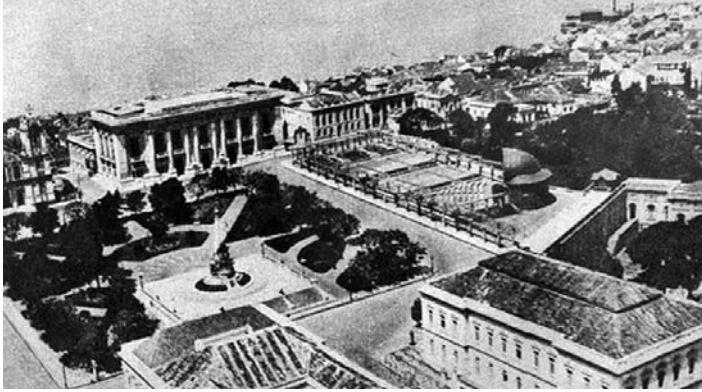
Fotografia 7 – Vista aérea da Praça Marechal Deodoro. (legenda original)

está associada à imagem do mesmo espaço disposta à página à esquerda. Nessa última vista aérea, o lago descortina-se ao fundo da praça, dando uma feição bucólica à cidade. A terceira está disposta várias páginas após as outras duas e impressa em papel de qualidade e dimensão diferenciadas daquele do restante do álbum. A página dobra-se em quatro partes para ser contida no tamanho do álbum. A vista é um panorama da área central da cidade, tendo em destaque o Cais do Porto e as embarcações atracadas no Lago Guaíba, no qual se pode observar o delineamento da ponta da península (fotografia 16).