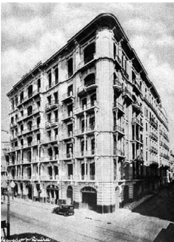
Fotografia 6 – Rua dos Andradas, esquina Paissandú. (legenda original)

Assinalo, então, que há apenas duas imagens de edificações na edição, privilegiando o formato vertical e isolando o prédio do seu contexto urbano. Assim, a imagem do Grande Hotel valoriza o desenho, que tende para uma linguagem modernizante, no qual as referências clássicas são discretas. A edificação conforma o quarteirão, embora tenha outros prédios no seu lado esquerdo. A fotografia, ao isolá-la da paisagem urbana do seu entorno, transfere a mesma imagem ao restante da cidade, apesar de não ser esta a configuração estrutural das edificações lindeiras. Essa percepção é corroborada em ima-