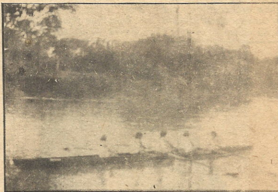
Neste domingo grande espetáculo no Rio Caí com a competição de Regatas.