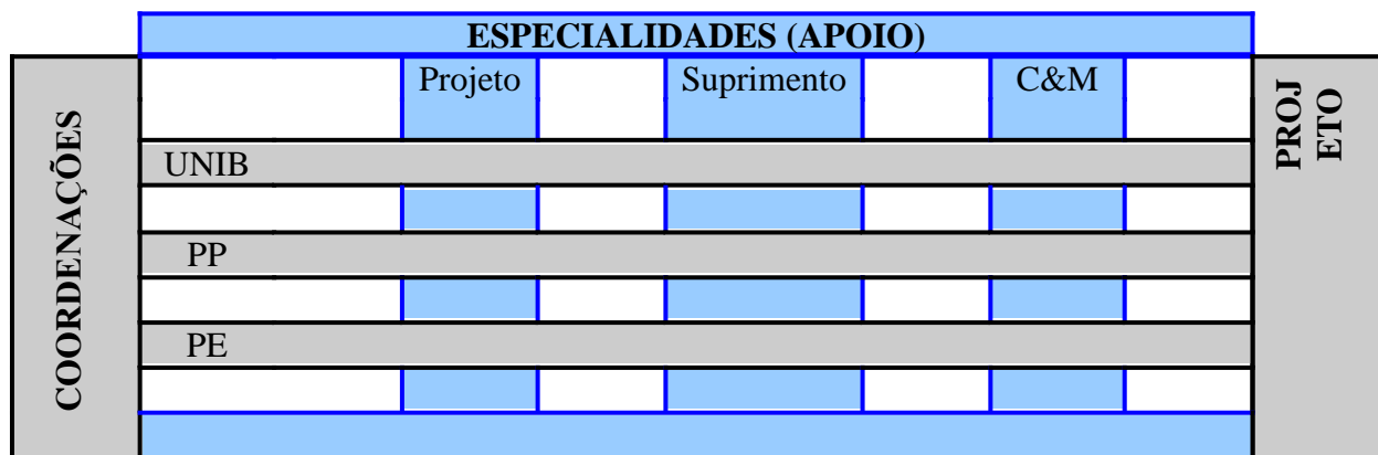
Figura 1 – Estrutura da área de projetos operacionais