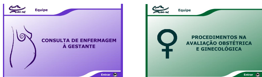
Figura 2: Layout dos objetos do PROADE III.

Metodologia: Em 2008, estão sendo desenvolvidos objetos educacionais voltados à área da saúde da mulher. Tais objetos buscam contemplar a Consulta de Enfermagem à gestante (conhecimentos básicos e simulações) e também procedimentos da avaliação obstétrica e ginecológica (Figura 2).