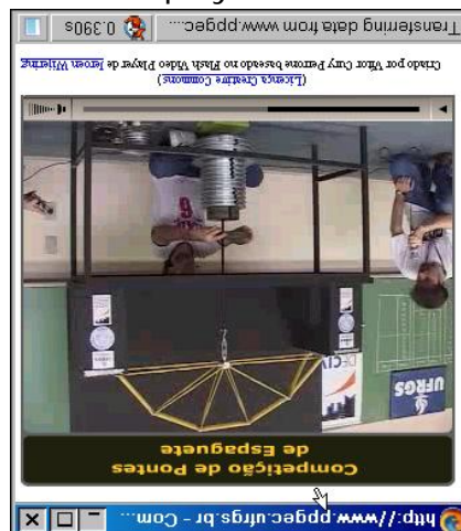
Figura 2 - Tela do player desenvolvido em Flash

Na Figura 2 é mostrada uma tela do player desenvolvido: