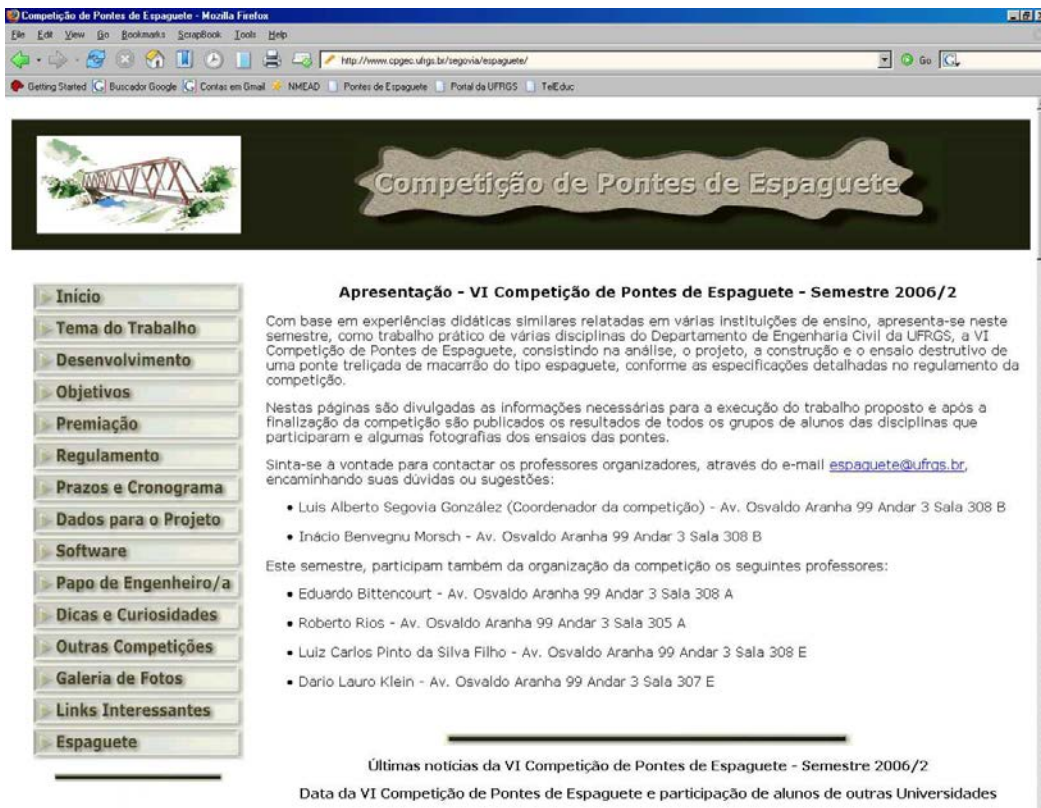
Figura 1 - Página de apresentação do site da Competição de Pontes de Espaguete

Na Figura 1 é mostrada a página de apresentação do site, disponível no endereço http://www.cpgec.ufrgs.br/segovia/espaguete .