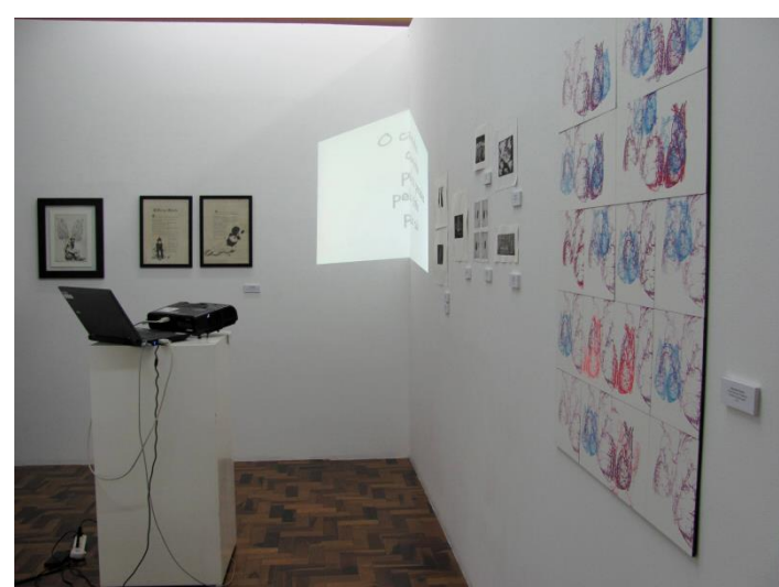
Imagens da Exposição Silêncios e Ruídos no Espaço Arte UM/Feevale