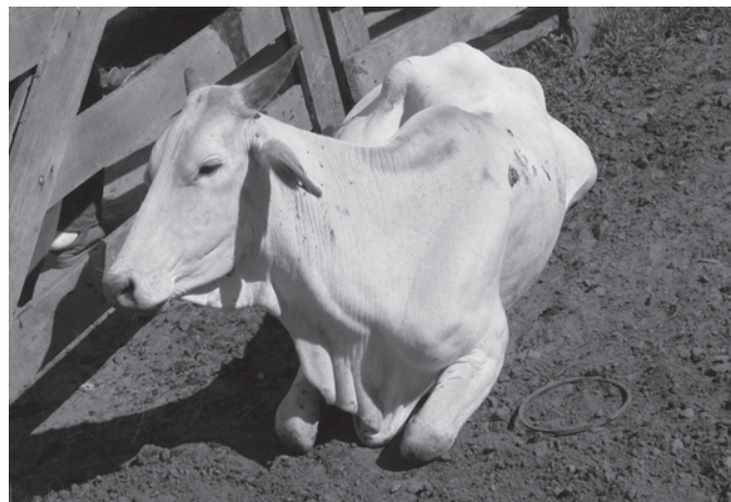
Fig.4. Bovino em decúbito esternal com a veia jugular ingurgitada, intoxicado pela ingestão de Amorimia exotropica no Estado do Rio Grande do Sul.

Na Propriedade C, localizada em Dois Irmãos/RS, havia um rebanho de 20 bovinos em um piquete de campo nativo com área de 1,5 hectares e pouca disponibilidade de pasto. Em junho de 2006, os bovinos ganharam acesso a um piquete novo, no qual havia uma capoeira, onde se observaram exemplares de A. exotropica com sinais de terem sido consumidos. Um mês após a entrada dos animais nesse novo piquete, dois "bois de canga" adultos morreram de forma súbita durante o trabalho. Trinta dias após, outro bovino (fêmea mestiça, sete anos, bovino 4)