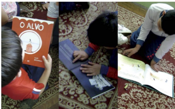
Figura 03: Manuseio dos livros pelas crianças.

Após manusearem os livros, as crianças foram convidadas a escolherem o seu favorito, levantando a mão para votar no livro selecionado. A Tabela 1 apresenta os resultados, que confirmaram que o livro “365 pinguins” realmente agradou ao público, que também gostou bastante da obra “Dois Ursos Famintos”, ratificando o que foi levantado na questão sobre os estilos de ilustração. Foi interessante observar, ainda, que o livro “Branca de Neve e as Sete Versões” foi considerado feminino pelos meninos da turma e que o livro “Biblioburro” não atraiu a atenção dos pequenos, talvez pela temática, afastada de seu cotidiano, talvez pelo estilo de ilustração, mais caricatural – o que pode se justificar, talvez, até mesmo como uma questão cultural.