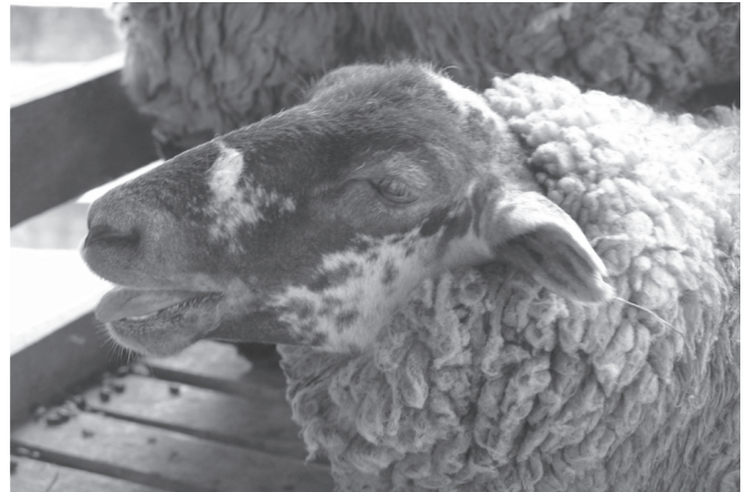
Fig.2. Neurotoxicose causada por Aspergillus clavatus em ovinos (Ovino 3). Animal respira com a boca aberta e expõe a língua.

A imunomarcagem do neurofilamento foi observada