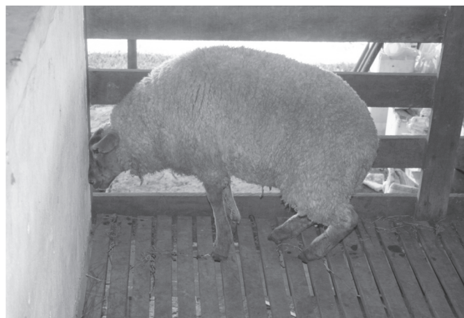
Fig.1. Neurotoxiose causada por Aspergillus clavatus em ovinos (Ovino 2). Animal demonstra fraqueza nos membros pélvicos e deslocamento do apoio para os membros torácicos.

Exceto pelo Ovino 4, nos demais, a frequência respiratória aumentou progressivamente e evoluiu para respiração com narinas dilatadas e, posteriormente, ofegante com a boca aberta e a língua exposta (Fig.2). O apetite permaneceu nesses ovinos até próximo da morte ou eu-