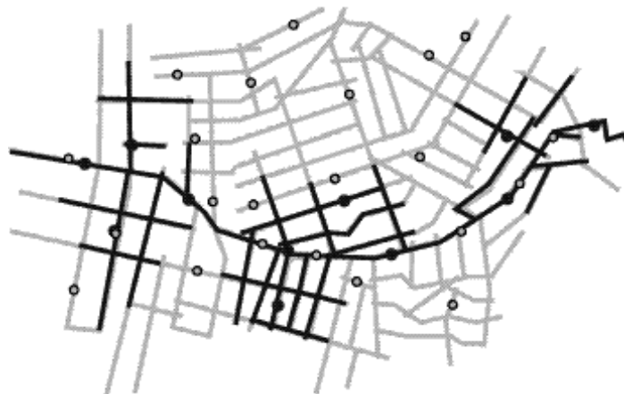
Figura 2: Esquema da representação analógica da ação das redes no tempo e no espaço urbano: as redes sociais atuam dentro das redes geográficas. Os pontos equivalem aos locais de atividades, e as linhas, aos espaços públicos utilizados pelas redes sociais.

As redes de movimentação devem ser sobrepostas com o objetivo de demonstrar simultaneamente o panorama de apropriações sociais por classes distintas. A representação das rotas de movimentação dos locais de habitação e atividade descritas pelas classes permite visualizar o uso dos espaços pelas redes das classes consideradas como um “mapa dinâmico”, no qual os movimentos e atividades assumem uma representação gráfica como linhas e pontos. A sobreposição de redes distintas sobre o mesmo trecho de espaço público indica que aquele espaço apresenta co-presença de classes diferentes, representando locais urbanos com contato visual entre indivíduos socialmente diferentes. A co-presença se torna contato potencial apenas quando há sobreposição de redes pedestres de diferentes classes, sendo espaços mais valorizados sob o ponto de vista da necessidade de interação de classes. Espaços axiais que se apresentarem vinculados a uma única rede podem ser considerados espaços segregados.