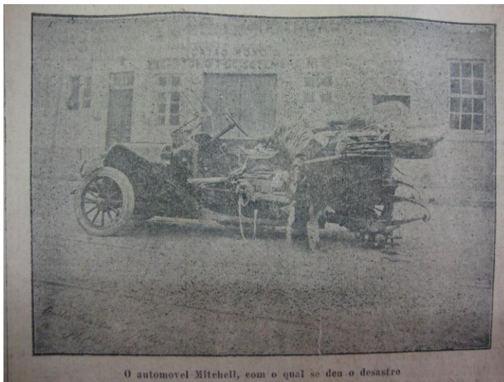
O automovel Mitchell, com o qual se deu o desastre