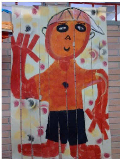
Figura 4