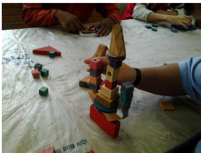
Figura 7: Interlocuções

Toda a sua experiência fica transparente em suas atividades em sala de aula, pois o professor procura buscar a criação do conhecimento de uma forma individual e posteriormente de uma forma coletiva, permitindo aos alunos visualizações, entendimentos do seu contexto sócio cultural e histórico abrindo campos para futuros questionamentos desses alunos. Com isso, verifica-se que a arte promove um desenvolvimento de habilidades, de conhecimentos diversos, de manifestações, apreciações, e interações com o meio e o outro.