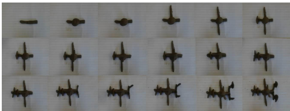
Figura 8: Sequência das fotos helicóptero

A cada aula os alunos estavam empolgados para serem os próximos a fazer as sequências das fotos e queriam logo ver o resultado, então resolvi trazer o vídeo montado na aula seguinte. Notei que os alunos ficaram impressionados com o resultado e ficaram contentes com seus trabalhos havendo também elogios para os colegas que haviam feito o Stop Motion .