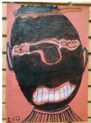
Figura 5

Em seus depoimentos, verifica-se que este pensar e fazer do professor também faz uma interlocução com a autora Iavelberg (2003), que nos diz: