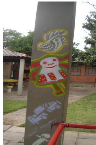
Figura 2 e Figura 3 Fotos: Adriana Klausen, 2012

Nas suas propostas o professor trabalha também as relações corporais, vestimentas e os espaços cenográficos para o teatro da escola. Desta forma, contempla a diversidade de possíveis ligações e interligações que ajudam os alunos a se desenvolverem e se conhecerem, criando uma ponte direta com o desenho e a pintura, linguagens que são sempre acessíveis aos alunos.