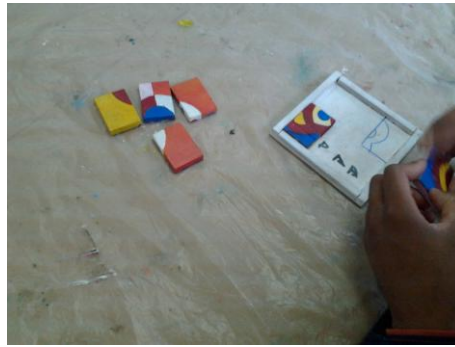
Figura 1: Quebra-cabeça