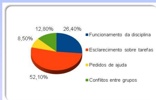
Gráfico 3: Temas dos correios eletrônicos