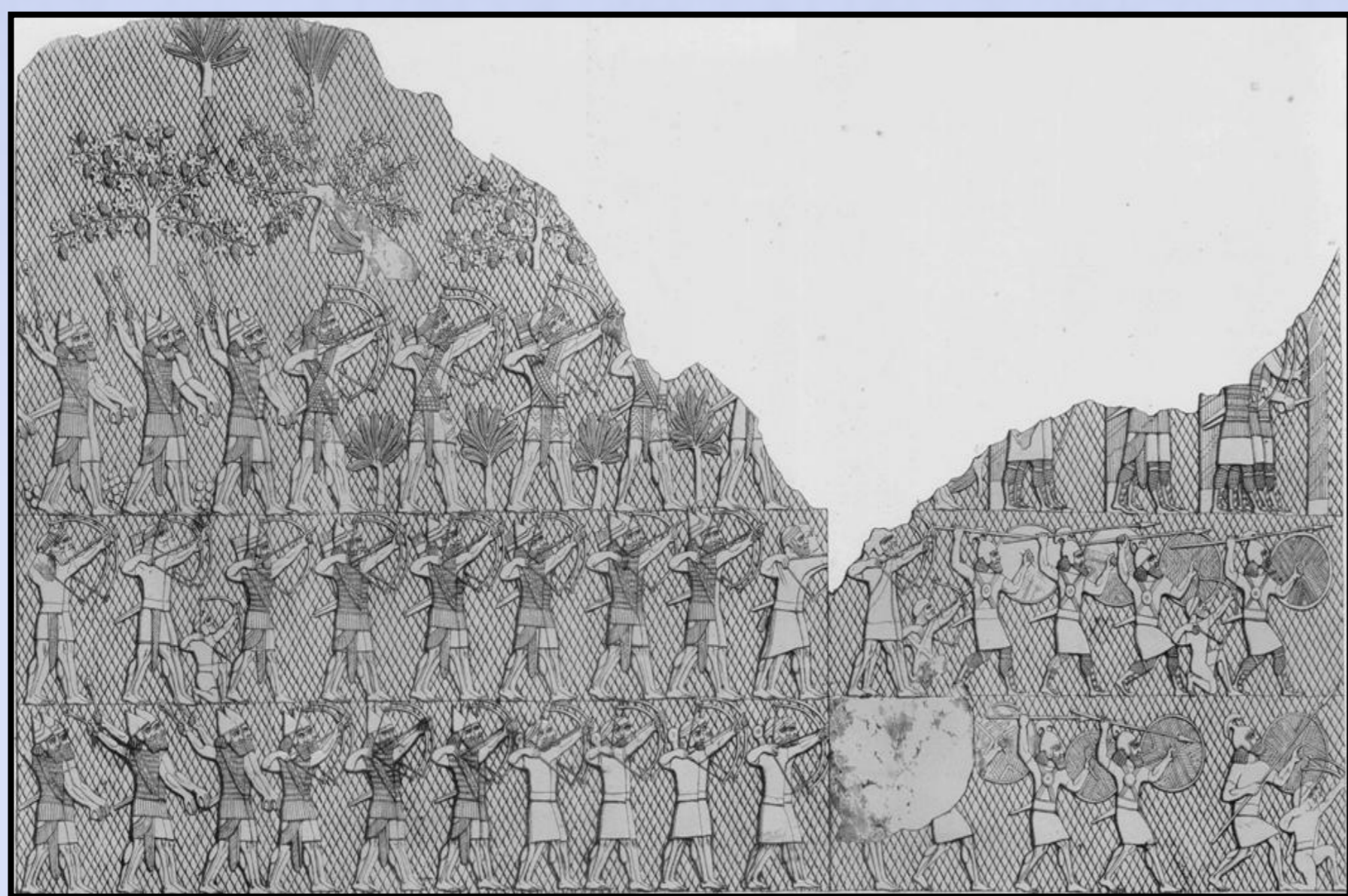
Desenho de Henry Layard a partir da Laje que representa o exército assírio antes da cidade de Lakiš (LAYARD, 1853, p.35)

Utilizamos a iconologia como método de análise das imagens, baseada nos estudos de Erwin Panofsky, que divide a análise em três etapas: a primeira consiste na descrição pré-iconográfica, enumerando os motivos artísticos e analisando séries de imagens. A segunda etapa é composta em análise iconográfica, ou seja a identificação de imagens, estórias e alegorias, combinando os motivos artísticos com os temas e conceitos a serem estudados. A terceira e última etapa da metodologia se resume em interpretação iconológica, a descoberta e interpretação dos valores simbólicos nas imagens.