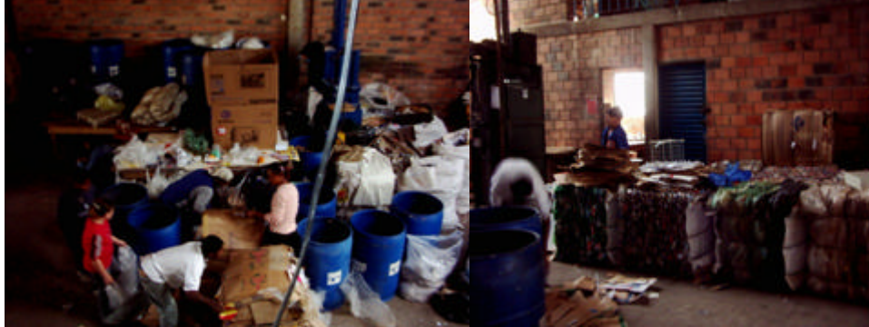
Figura 2 - Unidade de Triagem