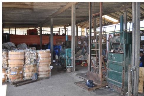
Figura5: Quinta etapa: Acondicionamento pós-prensagem

A quarta etapa consiste em encher a prensa de material, acionar a alavanca da prensa, amarrar os fardos, tirar cliques de papéis, tirar espirais de cadernos, tirar rótulos de embalagens plásticas e ensacar o material (alumínio, plásticos).