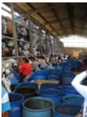
Figura 2: Segunda etapa: Triagem (separação) dos resíduos sólidos

Fazer a recepção dos resíduos sólidos encaminhados pelos caminhões da prefeitura, que procedem à coleta seletiva da cidade, ou de empresas que doam seus resíduos diretamente às associações, consiste na primeira etapa do trabalho. Primeiramente, os caminhões chegam e descarregam os resíduos, jogando-os do caminhão – que fica estacionado na parte externa da associação – para dentro do prédio. O material cai em uma estrutura de cerca protegida por arame, chamada de cesto (Imagem 2). O cesto é utilizado para estocar os resíduos antes de serem triados (separados). Invariavelmente, acabam caindo resíduos no pátio, no momento em que são projetados para o interior do prédio. Deste modo, faz parte do processo recolher os resíduos que caem pelo pátio e encaminhá-los ao cesto.