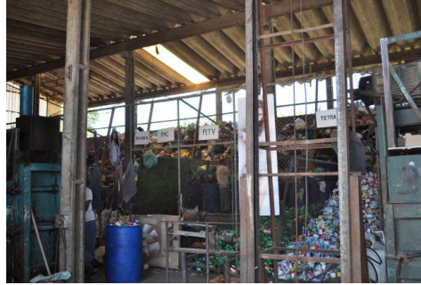
Figura 3: Terceira etapa: Acondicionamento pré prensagem

não possuem valor para serem comercializados. Deste modo, são dispostas bombonas (tonéis) para a separação de cada família de materiais e do rejeito (parte não comercializável dos resíduos que são encaminhados aos aterros sanitários). Durante este processo, são designadas trabalhadoras/trabalhadores para encaminhar o material já reciclado para os box (cercados onde são dispostos os materiais antes da prensagem, imagem 3).