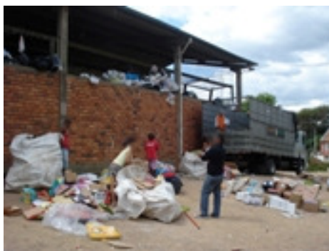
Figura 1: primeira etapa: recepção do material

por meio de imagens 8 , as etapas do processo de triagem de resíduos sólidos, bem como alguns termos utilizados: