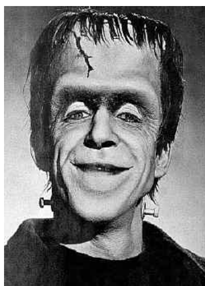
Figuras 2 e 3: À esquerda, Boris Karloff interpretando a criatura de Frankenstein; à direita, Herman, personagem popular da série norte-americana “The Munsters”.

Não temos em Herman uma alusão à criatura do romance. Ele representa uma apropriação do personagem do cinema, o “monstro Frankenstein”. Não se trata de uma alusão visual apenas; Herman é um idiota porque, assim como o monstro de Karloff, tem um cérebro defeituoso, algo que contraria a representação original da criatura como ser de grande inteligência. Muitas das populares adaptações e apropriações do romance Frankenstein foram criticadas como distorções do original. Realmente, há muitos distanciamentos do “original”, no entanto, nosso objetivo não é analisar adaptações a partir de noções de fidelidade. Buscamos demonstrar as resignificações, os diálogos, as interpretações e as reinterpretções que as obras literárias podem ter no cinema. “Distorcido” ou não, o fato é que o romance e sua autora permanecem vivos nos polissistemas literários em grande parte pela popularidade que cinema, TV e outras mídias massificadas lhes garantiram.