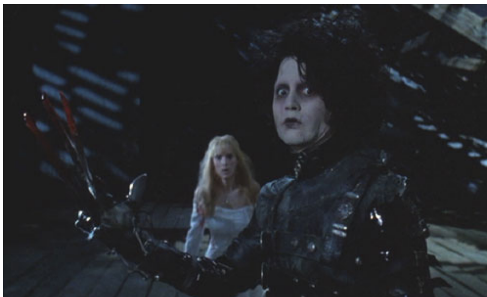
Figura 1: Expressão de Edward no final do filme de Tim Burton

Portanto, este trabalho busca explorar a relação entre o cinema e a literatura sem fazer uma análise baseada nas noções de valor ou de originalidade, mas sim demonstrando os diálogos entre os dois gêneros e suas distinções.