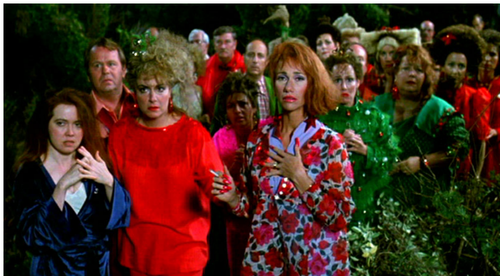
Figura 17: Cena de Edward Mãos de Tesoura (BURTON, 1990)

Na primeira figura, temos o episódio da perseguição da criatura no filme de Whale – a comunidade corre para matar o monstro assassino. Em Edward Mãos de Tesoura , temos uma cena semelhante na qual os vizinhos correm perseguindo Edward, não para linchá-lo, mas para contemplar o final trágico do duelo entre Jim e Edward – que termina com a morte do último. Edward é alvo da incompreensão, da estranheza e da curiosidade dos vizinhos. Essa curiosidade, misturada com certa crueldade, está presente no filme de acordo com o próprio Burton, em entrevista: