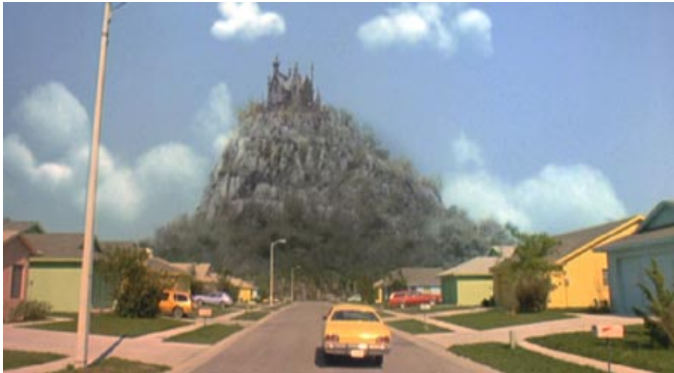
Figura 11: Contraste entre o castelo sombrio e a cidade colorida

Apesar de os dois “monstros” desejarem a inclusão na comunidade, eles não são aceitos totalmente. A sociedade não aceita o diferente, o estranho. Essa diferença no filme está marcada visualmente. O exagero das cores em Edward Mãos de Tesoura mostra o distanciamento e a oposição entre ele e o que está relacionado a ele (suas roupas, sua casa, etc.) marcado pelas cores escuras (e a cinematografia em sépia, apagada) e o que está relacionado com a comunidade na qual tenta incluir-se (marcada por cores vivas, tanto nas casas quanto nas roupas), como podemos ver nas imagens abaixo, nas quais fica bem evidente o contraste de tratamento de imagens; brilho intenso, luminosidade para as cores da cidade e um apagar de contornos, embaçamento de foco para a colina e a mansão: