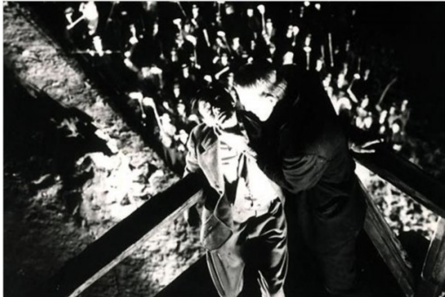
Figura 16: Cena de Frankenstein (WHALE, 1931)