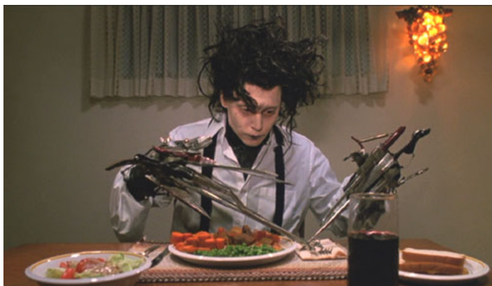
Figura 15: Edward

Joyce (Kathy Baker), personagem vizinha da casa de Peg, acusa Edward de assédio, sendo que foi ela quem tentou seduzi-lo e foi repelida. O clima leve do início do filme, com cenas engraçadas, que mostravam a inabilidade de Edward para executar tarefas comuns, como a cena em que ele tenta comer, por exemplo, vai, aos poucos ficando mais tenso, pois vemos que o personagem não foi verdadeiramente acolhido, que o estranho não tem lugar naquela comunidade e que sua inocência o torna frágil demais para viver ali.