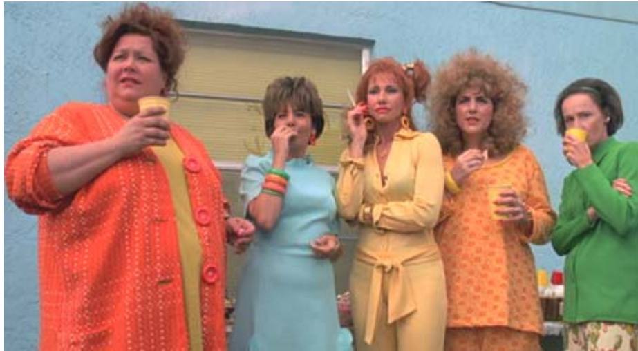
Figura 12: Vizinhas