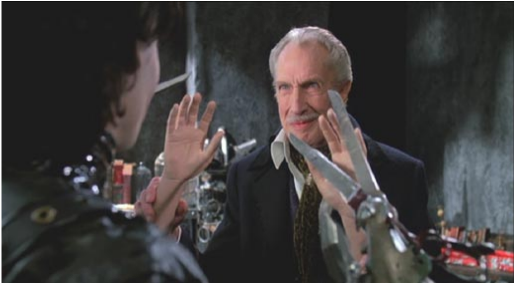
Figura 8: Inventor