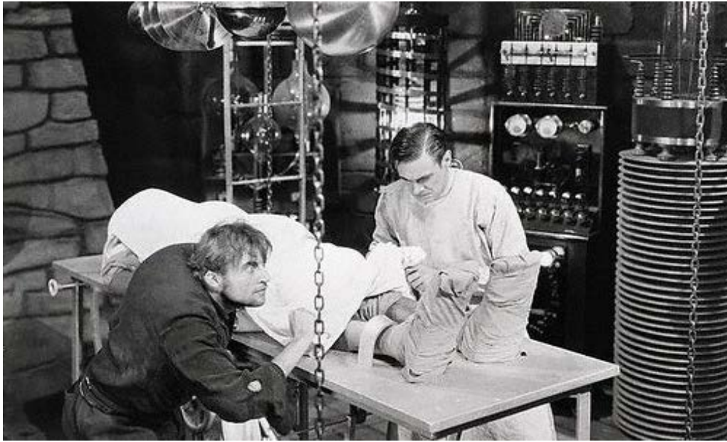
Figura 5: Cena do laboratório de Frankenstein no filme de Whale (1931)

No romance, é mencionado o quarto onde Victor Frankenstein realiza seus trabalhos: