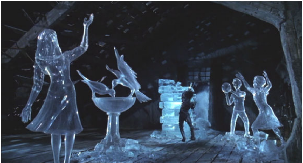
Figura 19: Cena final de Edward Mãos de Tesoura