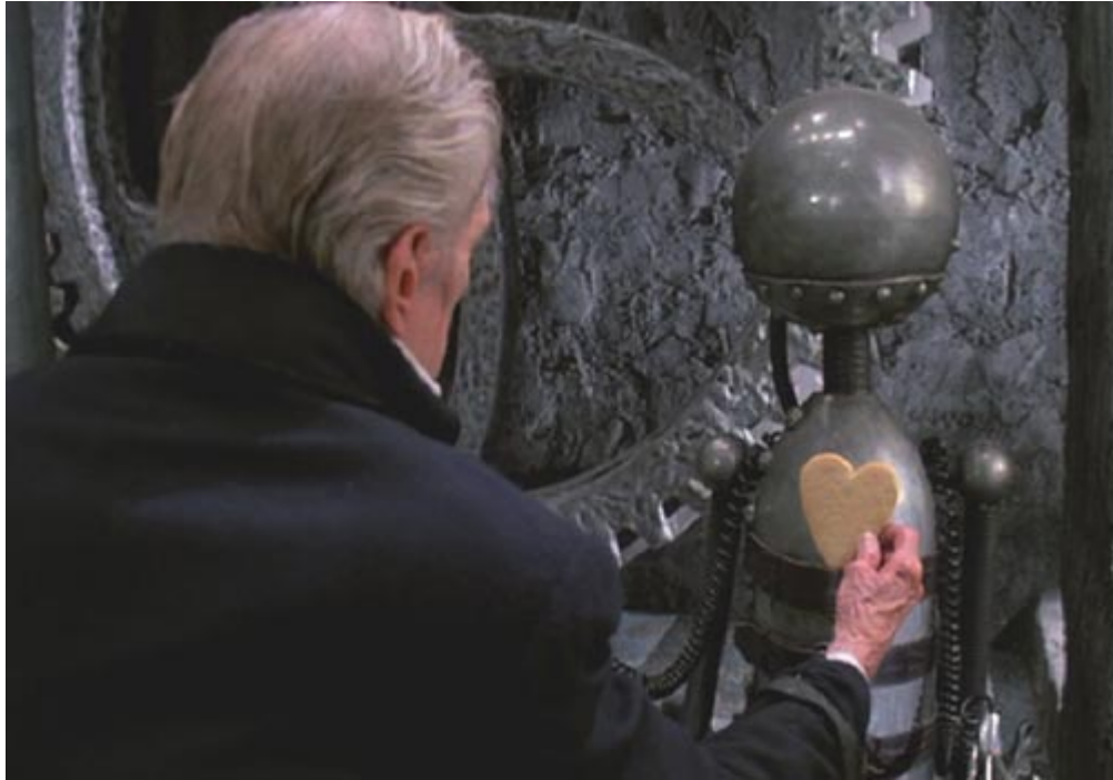
Figura 6: O inventor, em Edward Mãos de Tesoura

Em oposição a esse desejo, vemos que a ambição de Victor Frankenstein é mais egoísta - criar uma nova espécie, o que o igualaria a Deus: