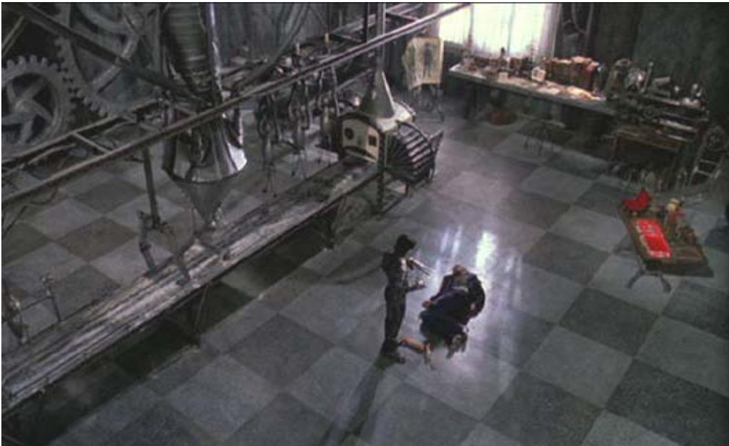
Figura 9: Morte do inventor

Como Edward machuca aqueles que ama, com a morte de seu criador, aquele que lhe daria mãos, ele está condenado a ficar solitário. Victor Frankenstein, por outro lado, não se preocupa com a sua criatura. Ele não suporta a sua aparência após ter-lhe dado vida e acaba fugindo, deixando sua criatura – assim como Edward - sozinha: