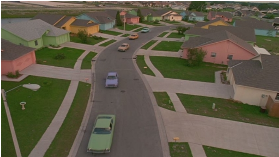
Figura 13: Subúrbio