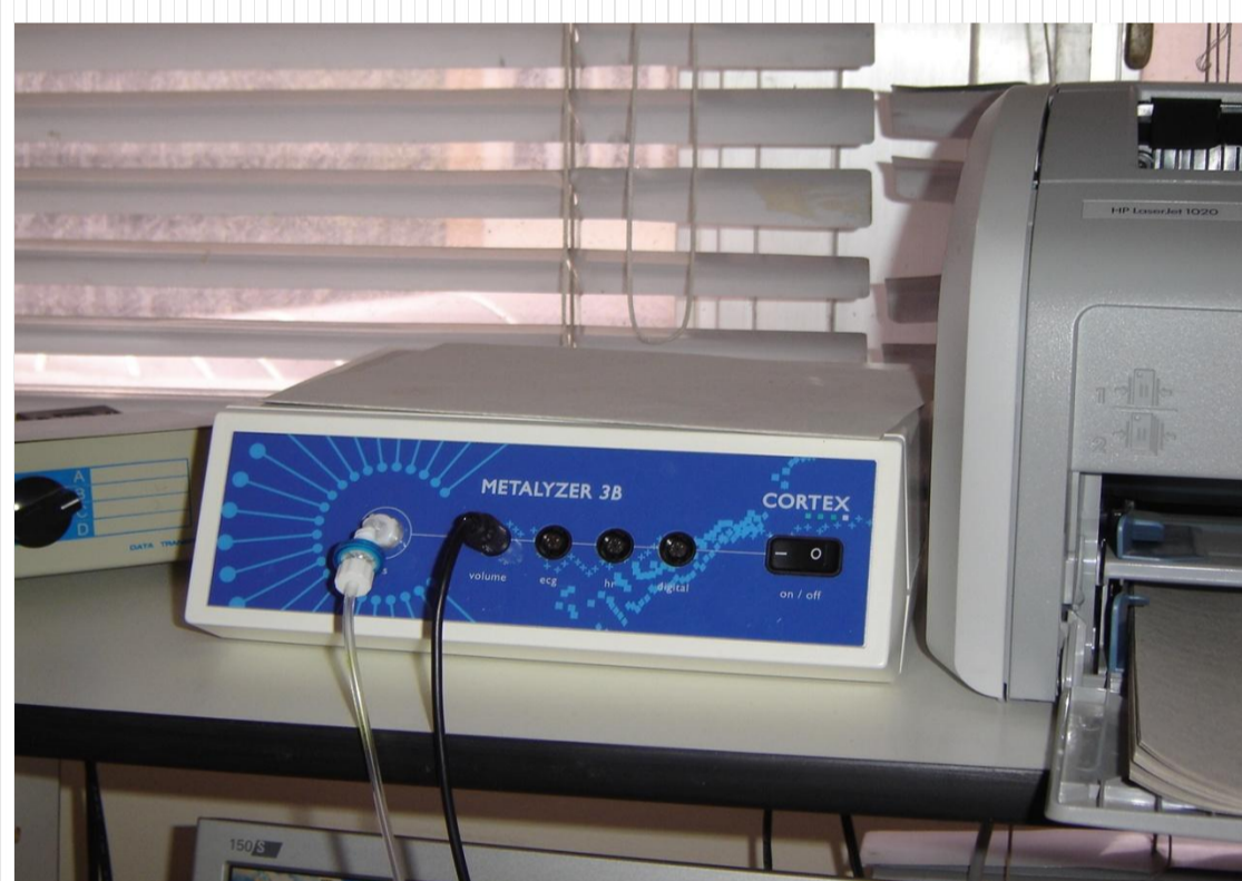
Figura 1: Calorímetro

Materiais e Métodos : Estudaram-se 24 pacientes com carcinoma epidermóide de esôfago sem intervenção prévia do Grupo de Cirurgia do Esôfago, Estômago e Intestino Delgado do Hospital de Clínicas de Porto Alegre. O GEB foi aferido pela HB, BI e CI. A avaliação nutricional foi por antropometria, bioquímica e capacidade pulmonar.