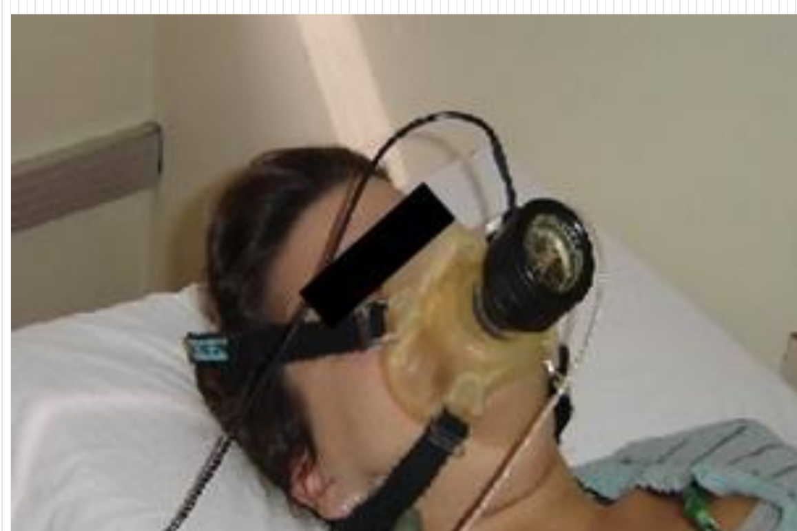
Figura 2: medição