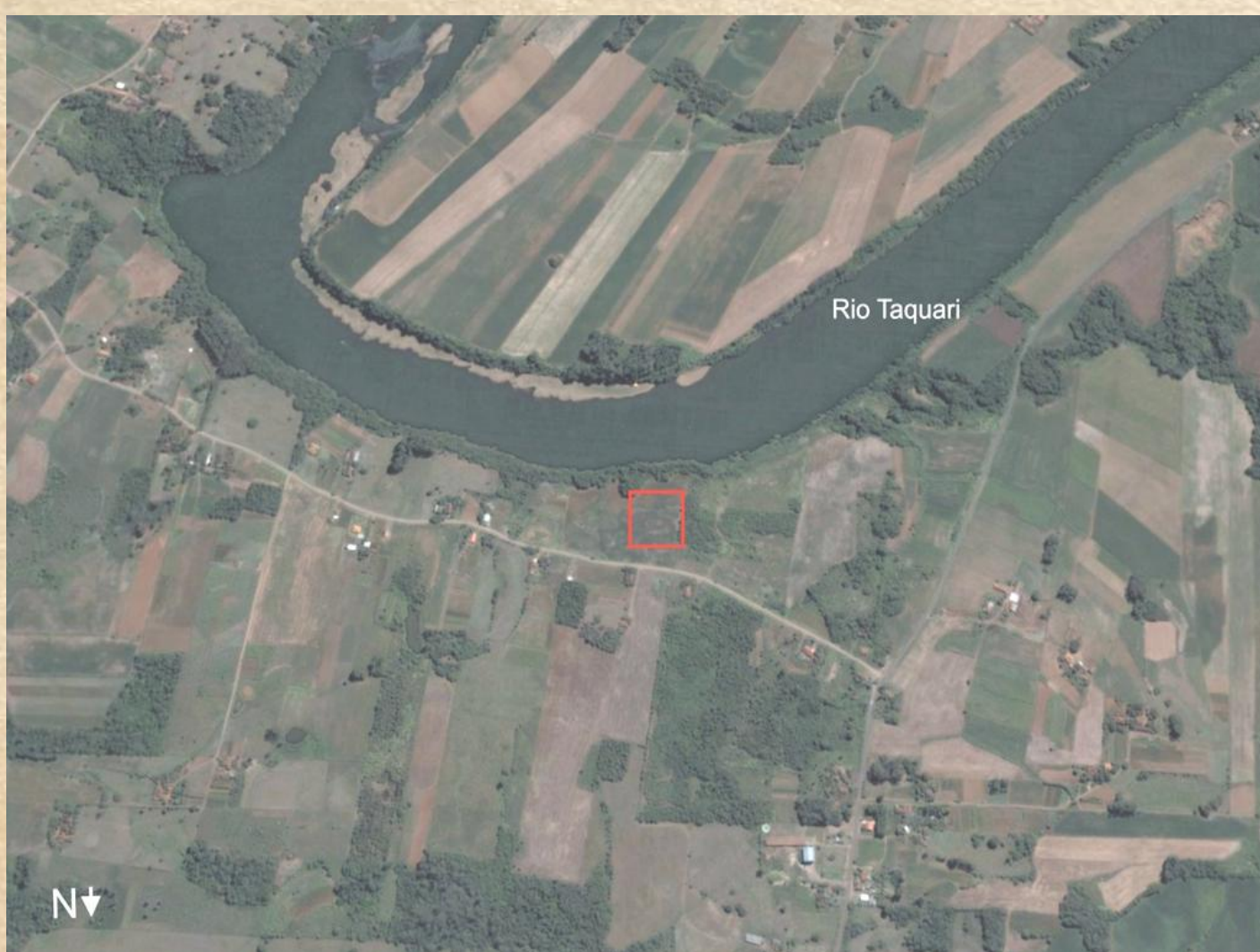
Imagem de satélite da área do sítio arqueológico.

As pesquisas realizadas pelo Setor de Arqueologia do Centro Universitário Univates visam compreender os diferentes processos de ocupação dos grupos humanos que habitaram a Bacia do rio Taquari-Antas. O sítio arqueológico pré-colonial – o RS-T-119 – está localizado em uma meia-encosta, na margem esquerda do rio Taquari, no município de Colinas, inserido na região geopolítica do Vale do Taquari, no centro leste do estado do Rio Grande do Sul.