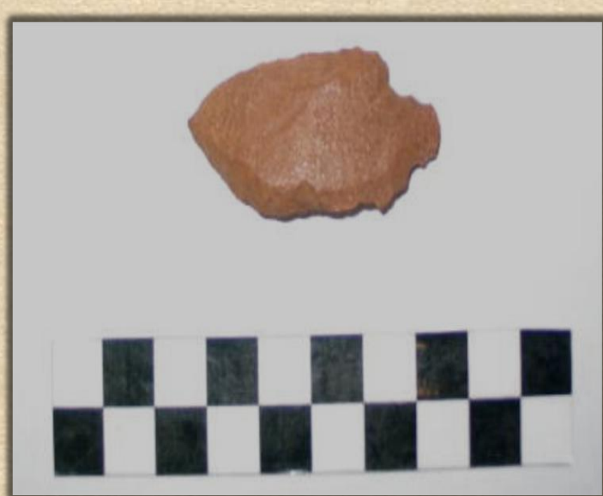
Ponta de projétil em arenito silicificado.

Com as informações obtidas até o momento sobre o sítio e sua cultura material acreditamos tratar-se de uma ocupação associada a grupos da Tradição Tecnológica Tupiguarani e caçador-coletor. A coleção de fragmentos de vasilhas cerâmicas, no total 1306, apresentou-se em maior quantidade de fragmentos cerâmicos correspondentes a paredes, na sequência bordas, bases e massas. Com relação ao tratamento de superfície o corrugado representa 50% do total de fragmentos. A partir da distribuição intra-sítio das evidências não identificaram-se concentrações de material, sendo que a dispersão do material ocorre numa grande área, tampouco uma camada de NSA e vestígios arqueofaunísticos. A coleção de evidências líticas tem a ocorrência de talhadores, bifaces, núcleos e lascas de calcedônia, lascas de basalto, alguns fragmentos de arenito friável e material com negativos de polimento e exposição ao fogo, assim como uma ponta de projétil, instrumento associado tradicionalmente à ocupação caçador-coletor. O resultado da análise indicou as cascalheiras - que margeiam o rio Taquari - como áreas em potencial para a captura das matérias primas líticas. De um total de 545 instrumentos líticos, quatro matérias-primas básicas apresentaram-se no sítio: basalto (65,6%), calcedônia (19,6%), arenito friável (2%) e arenito silicificado (12,6%).