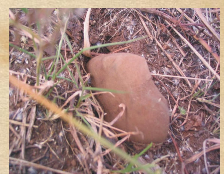
Artefato lítico encontrado em atividade de coleta superficial.