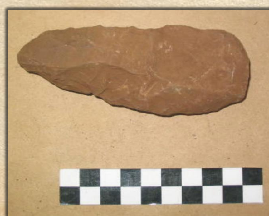
Peça bifacial.