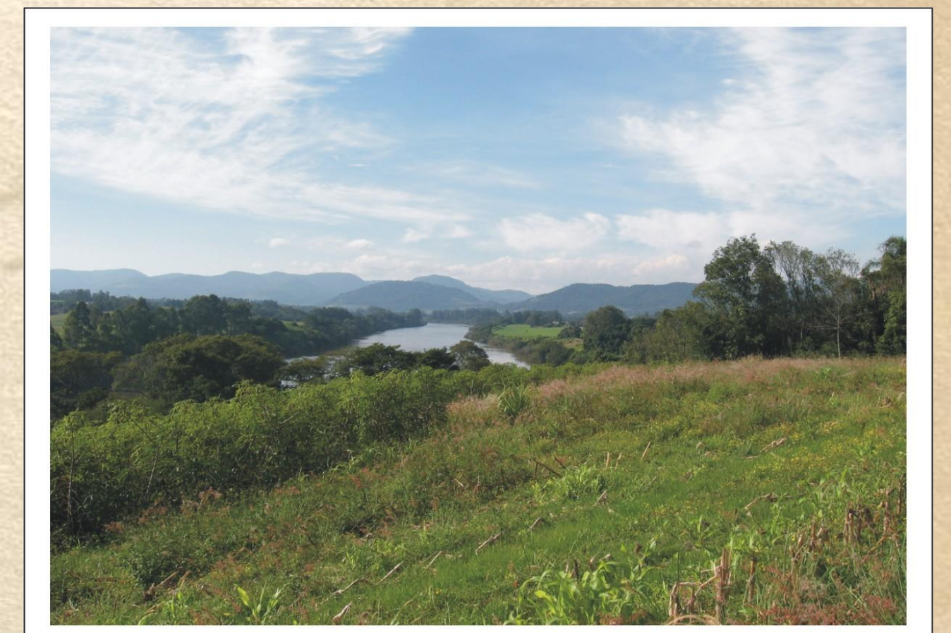
Na imagem, é possível visualizar a cadeia de montanhas que vai tornando o Vale do rio Taquari cada vez mais encaixado.