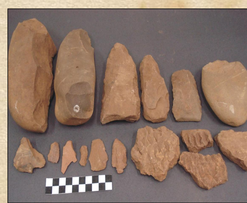
Material cerâmico e lítico.