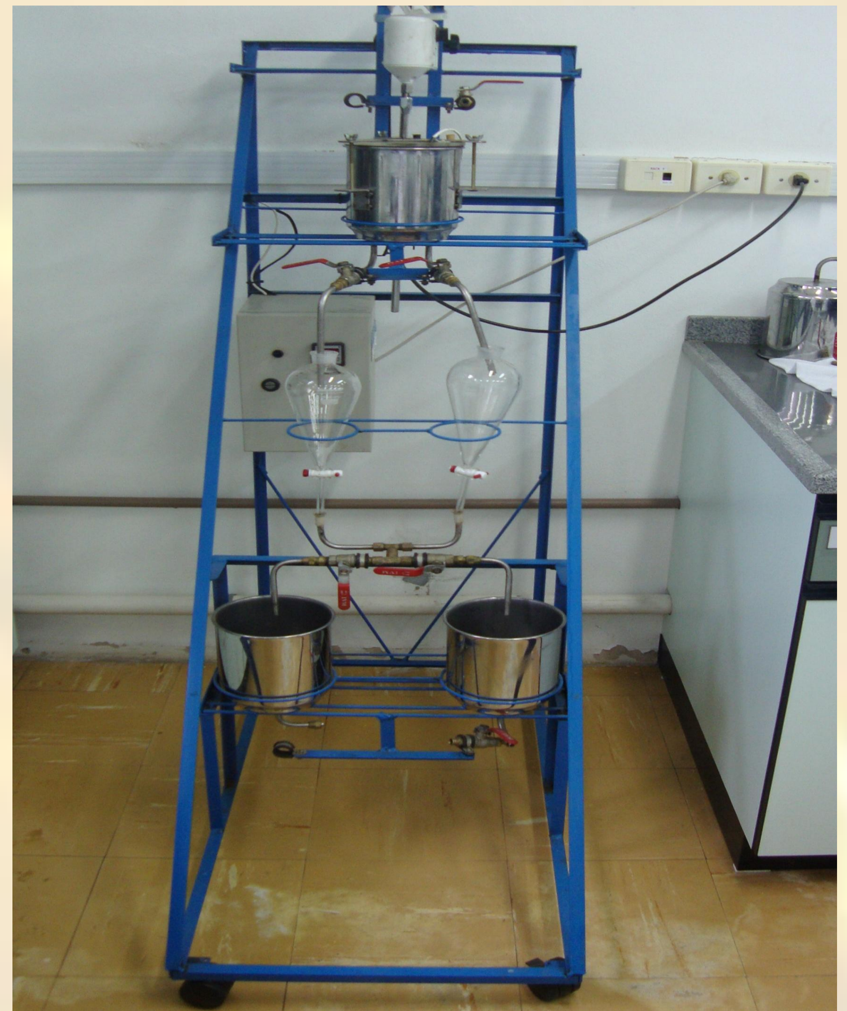
Figura 2: Reator Batelada

Foram realizados nove experimentos em reator batelada mostrado na figura 2. As variáveis estudadas foram: a razão molar óleo/álcool (1/3, 1/6 e 1/9) e a temperatura da reação (40, 60 e 70°C) no tempo de 1 hora. Após esse período, o produto foi mantido em descanso por 1 dia, e em seguida houve a separação do biodiesel da glicerina através de funil de separação.