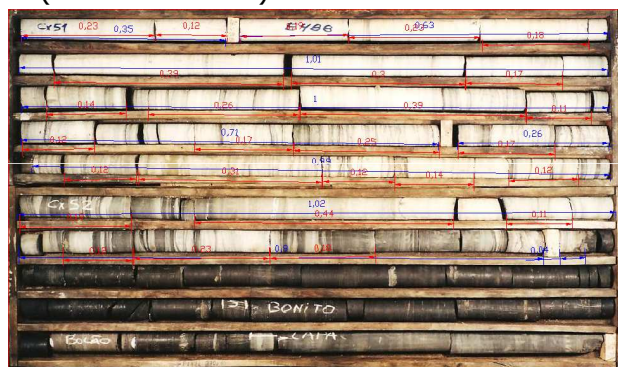
Figura 1: Caixa com testemunho de sondagem.