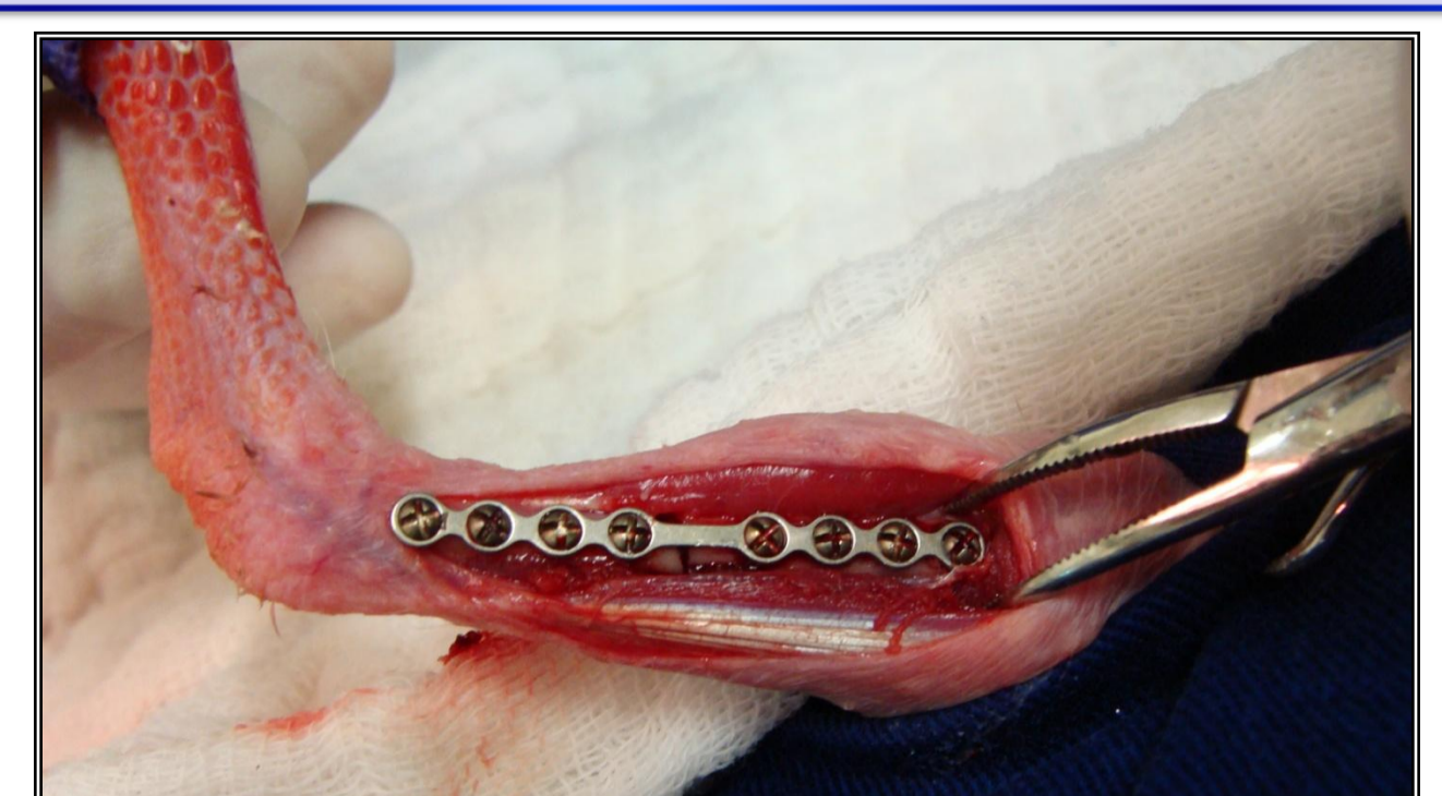
Figura 3 - Osteossíntese de tibiotarso com o uso de microplacas de titânio do grupo 3.