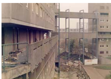
(b) Vista passarelas e blocos