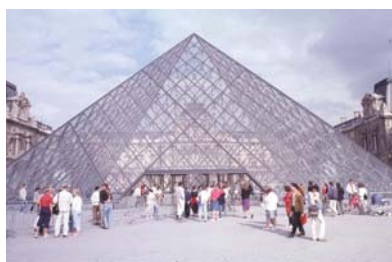
(a) Vista acesso Pirâmide com antigo museu nas laterais e ao fundo