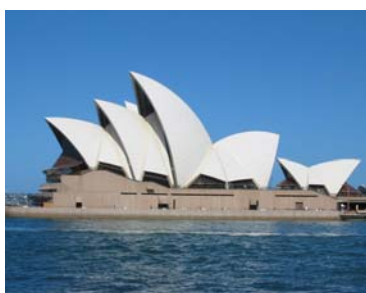
(b) Vista lateral