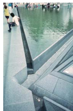
(c) Uso e detalhe do espelho d'água junto à Pirâmide