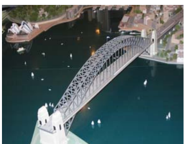
(a) Maquete com Ópera House à esquerda