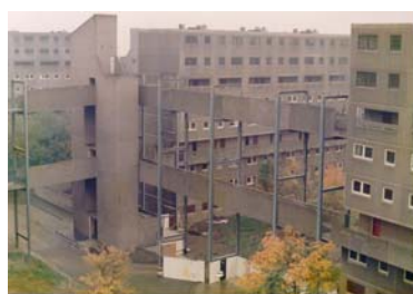
(a) Vista passarelas e blocos

Ainda, o Bronx Development Center (Centro de Desenvolvimento do Bronx), em Nova York, completado em 1976 por Richard Meier e Associados, consiste de um conjunto com blocos de quatro pavimentos revestidos com chapas de alumínio polidas, destinado a abrigar crianças com necessidades mentais especiais em “uma atmosfera caseira e acolhedora”. Além de citações lisonjeiras de críticos americanos de arquitetura, o projeto recebeu vários prêmios de arquitetura, alguns dos quais do Instituto Americano de Arquitetos em 1977, um pouco mais de um ano antes do edifício ser ocupado. Contudo, após sua ocupação, apareceram opiniões negativas relacionadas, por exemplo, à falta de segurança em função de determinadas soluções arquitetônicas tais como caixas de escada e guarda-corpos muito abertos e uso de vidro não temperado em muitas áreas; e à aparência não aconchegante (MITCHELL, 1993).