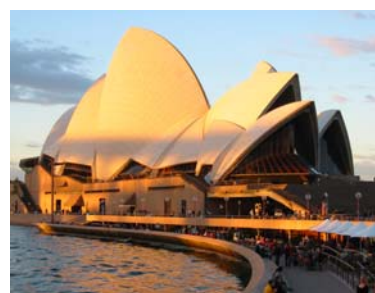
(c) Conexão Ópera House com bares e restaurantes nas proximidades