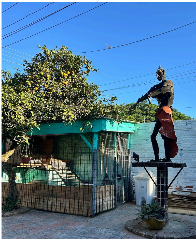
Figura 3 – Imagem em ferro do Orixá Baráf