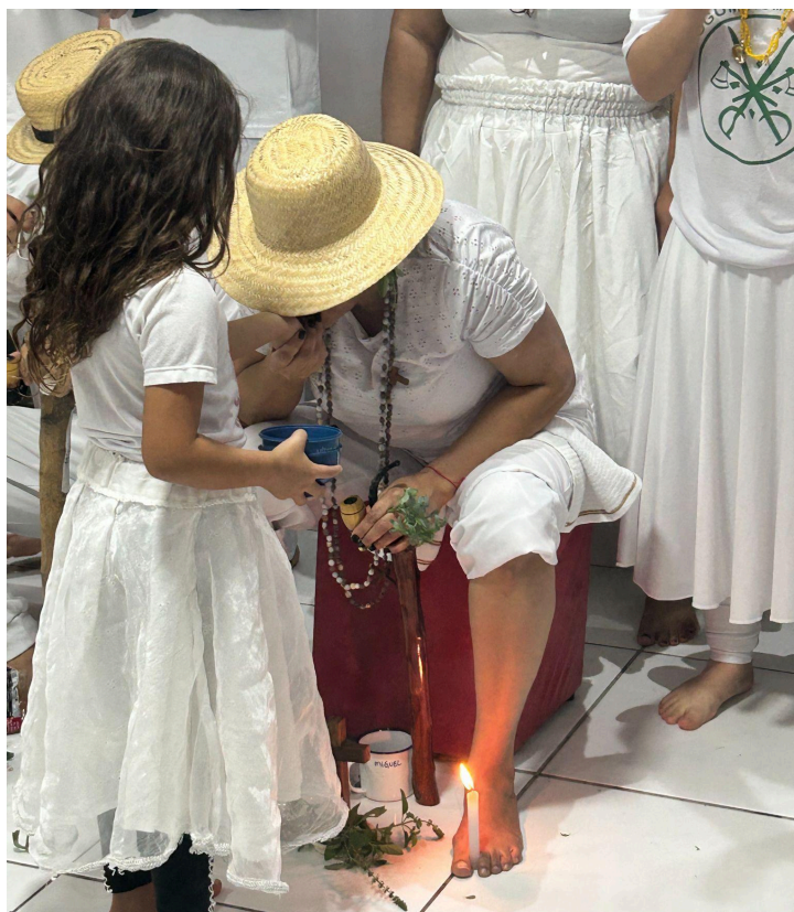
Imagem 5 - Criança e preto velho

Essa lógica da circulação do axé por meio das moedas não se restringe aos adultos. Durante a festa, crianças também se aproximam das entidades para realizar a entrega, aprendendo, na prática, os gestos e os tempos do ritual, conforme é possível observar na imagem 5, a seguir: