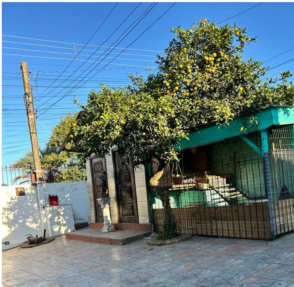
Figura 2 – Casa dos exus e espaço de acolhimento dos animais.