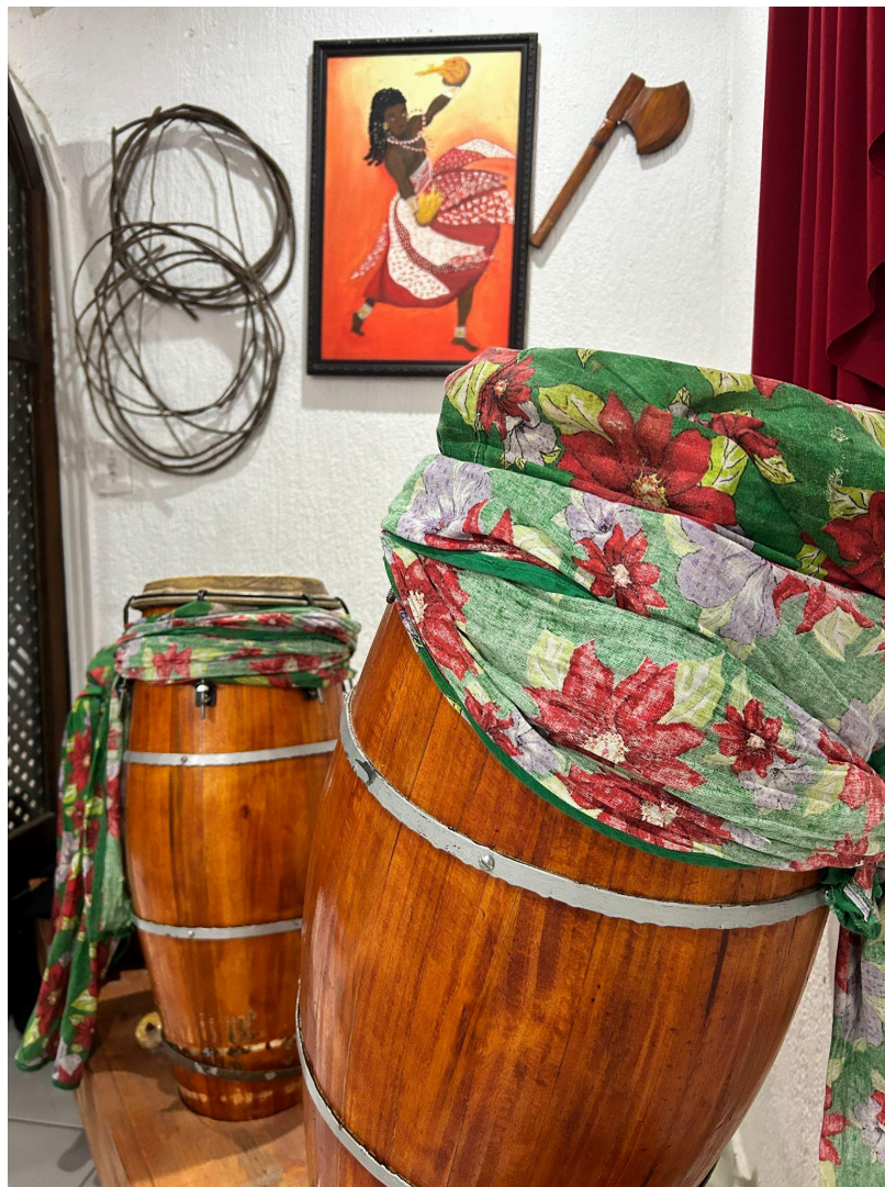
Figura 4 – Atabaques

pequenas casinhas vermelhas, dispostas simetricamente, e, logo adiante, a imagem central de Bará, ladeada pelas imagens de Oxum e Oxalá. Na parede lateral esquerda localizam-se os assentamentos dos Orixás, resguardados por uma cortina vermelha que delimita simbolicamente o espaço resguardado a família religiosa e regula o acesso visual aos fundamentos. Já na parede lateral direita, uma cortina vermelha, disposta até a altura de um balcão que se estende por toda a parede, cumpre função semelhante; sobre esse balcão encontram-se algumas imagens africanas de Orixás.