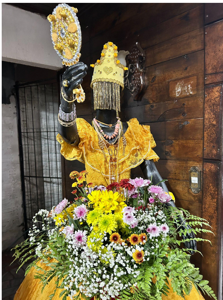
Figura 6 — Imagem em tamanho real da Orixá Oxum decorada