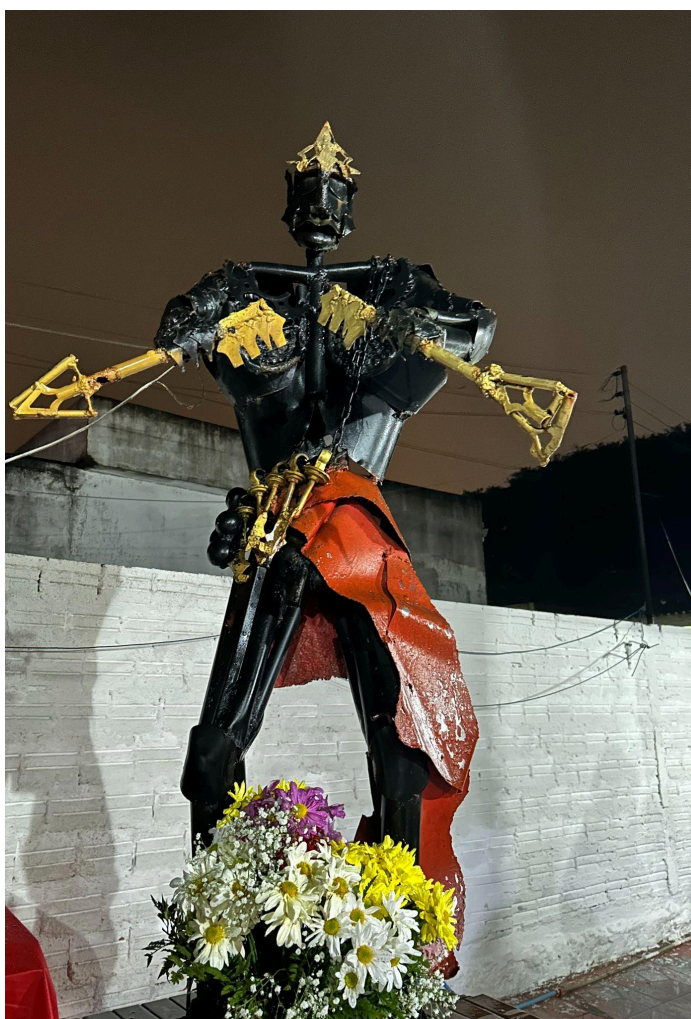
Figura 5 — Orixá Bará em ferro decorado