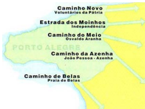
Mapa de Porto Alegre/1820