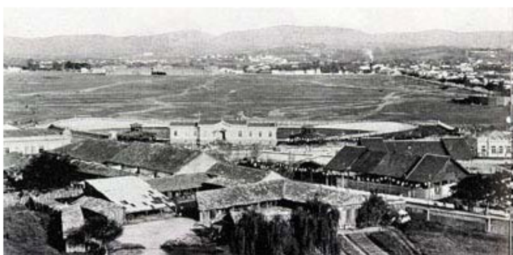
início do século XX

Pude observar através das fotografias e dos cronistas como se davam essas diferentes formas de sociabilidade e a apropriação com que foi feita no espaço. Como exemplo disso trago essa fotografia que é datada do início do século XX. Em primeiro plano vemos os pavilhões da Exposição de 1901. Em segundo plano, ainda não ajardinado o “Campos da Várzea”. Atrás desses pavilhões do lado esquerdo da foto localizava-se o Velódromo e a direita próximo ao Caminho da Azenha (hoje Av. João Pessoa) o Circo de Touradas.