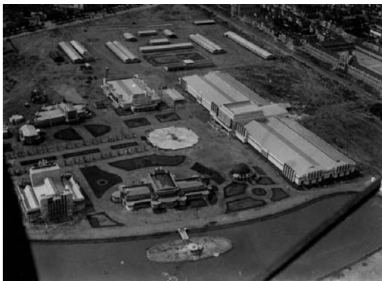
Vista aérea da Exposição de 35

Farroupilha. Para que ela acontecesse foi adotado, em parte, o ante-projeto de ajardinamento 11 previsto para área em 1930 (Macedo, 1973:111). No projeto que foi realizado aproveitou-se a extensão que o “Campos da Redenção” oferecia para criar um grande lago, chafariz e traçar caminhos que unissem os espaços. O desenho de um eixo central ligando o Monumento ao Expedicionário aos prédios da UFRGS foi muito importante para a configuração do Parque que nós conhecemos hoje.