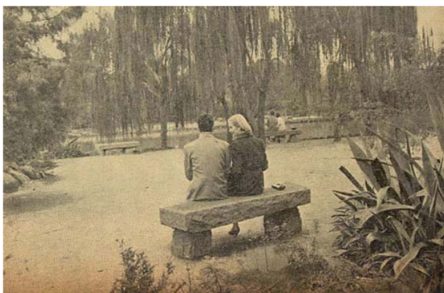
Desconhecido, 1950 Fonte: Revista do Globo