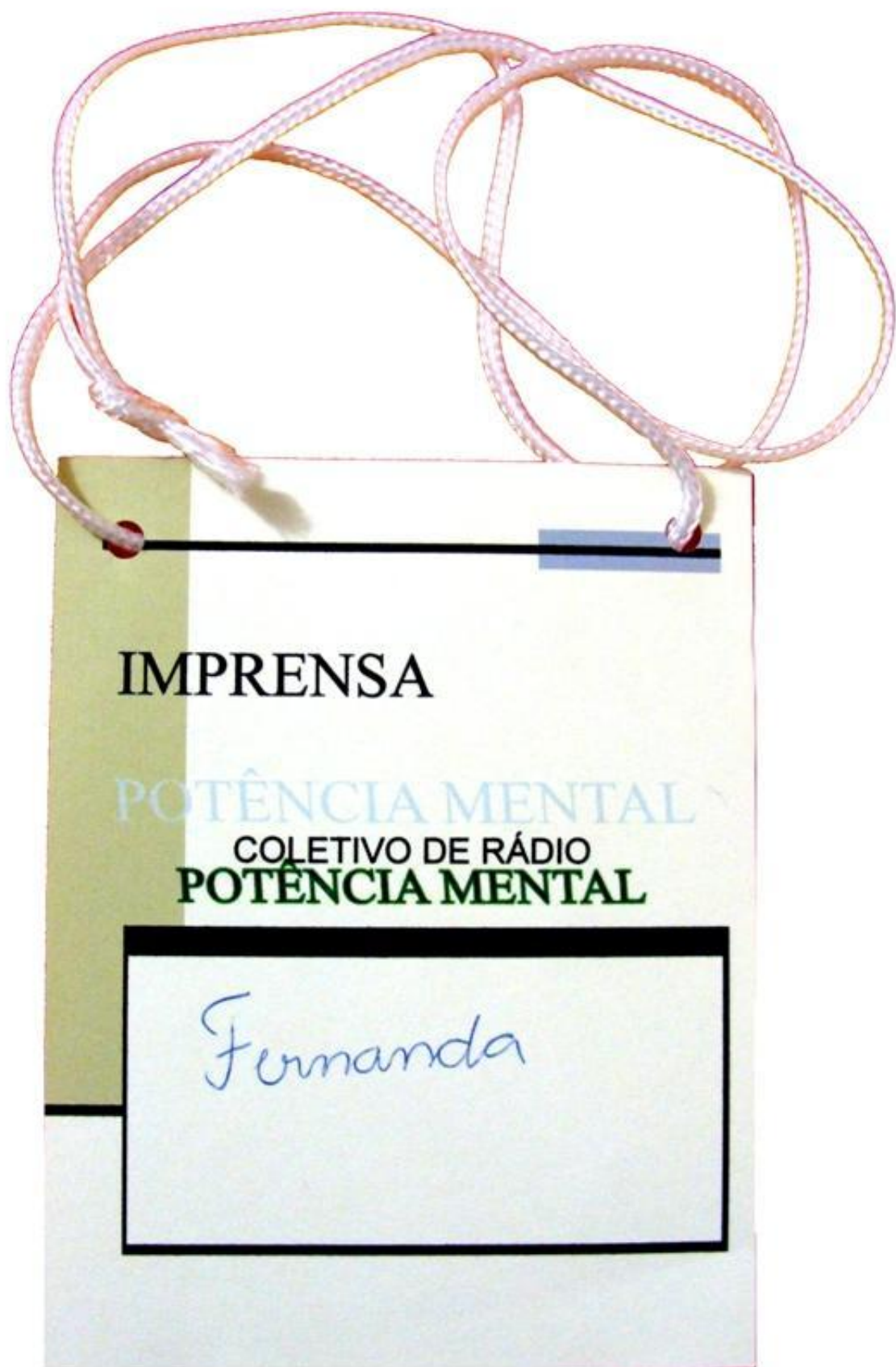
Crachá do Coletivo Potência Mental