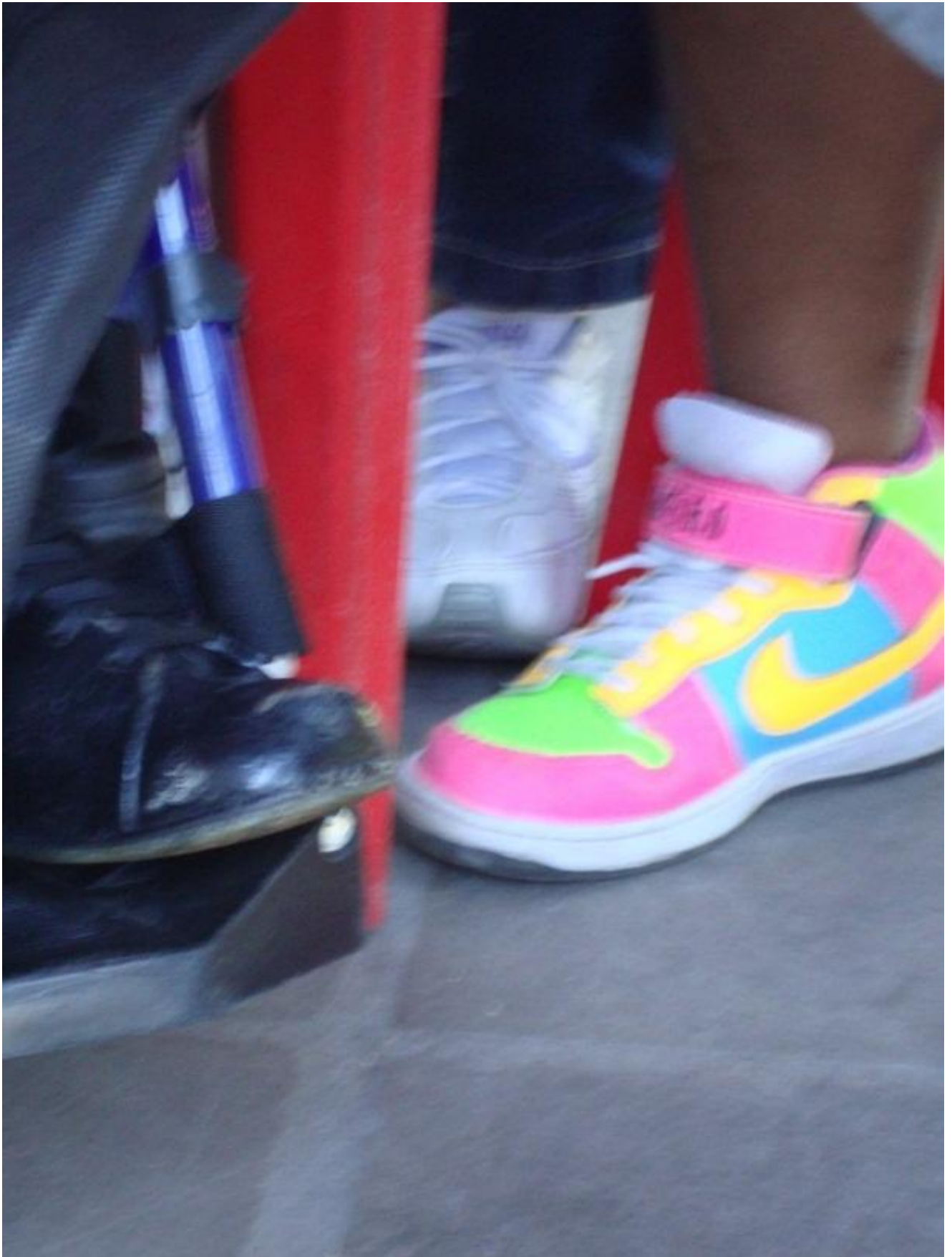
Fotografia de uma reunião do Coletivo de Rádio Potência Mental