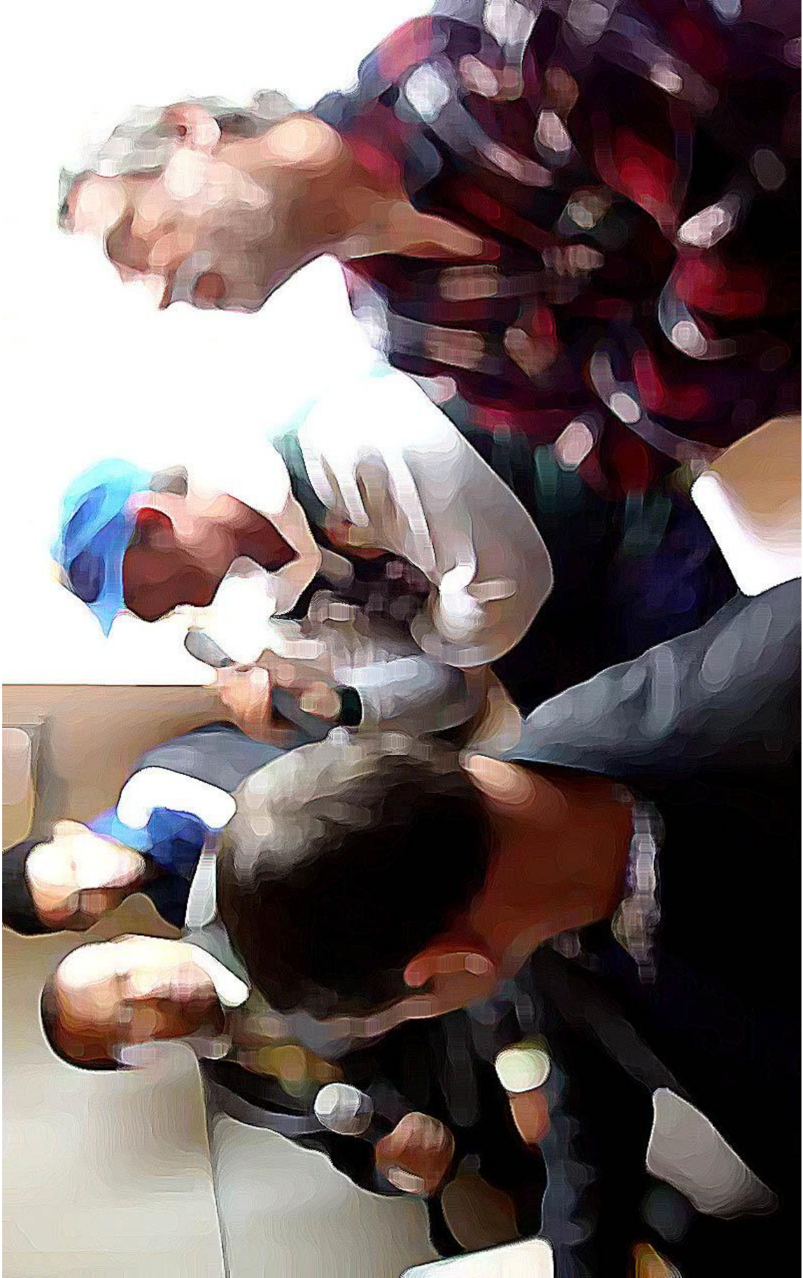
Imagem selecionada de um vídeo feito de um dos programas do Potência Mental