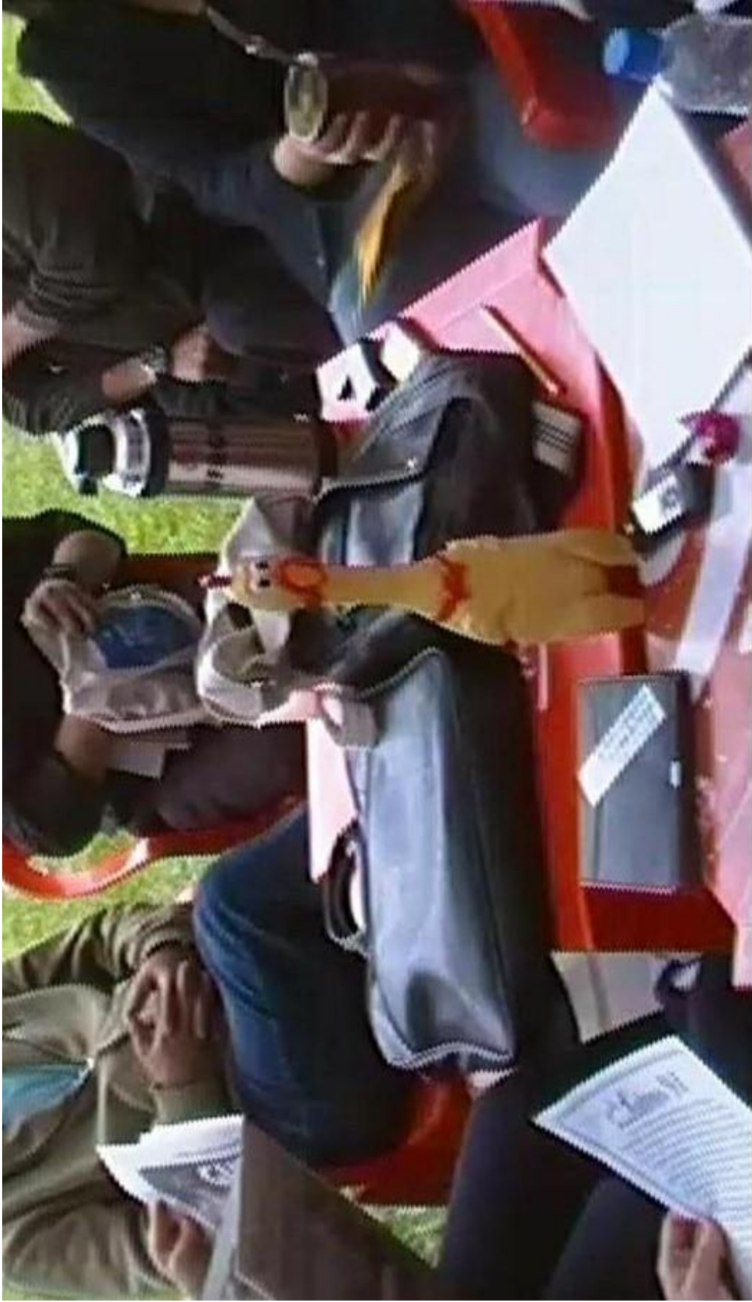
Imagem selecionada de um vídeo feito em uma das reuniões do Coletivo de Rádio Potência Mental