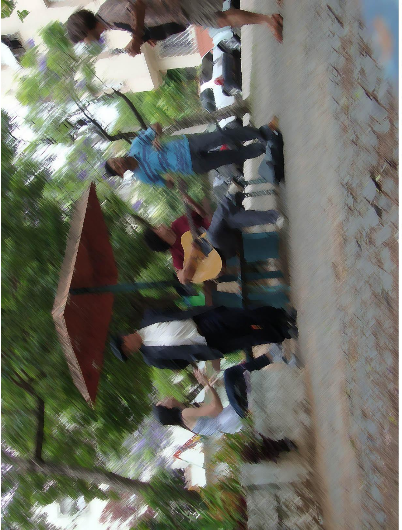
Fotografia de um momento de confraternização do Coletivo de Rádio Potência Mental