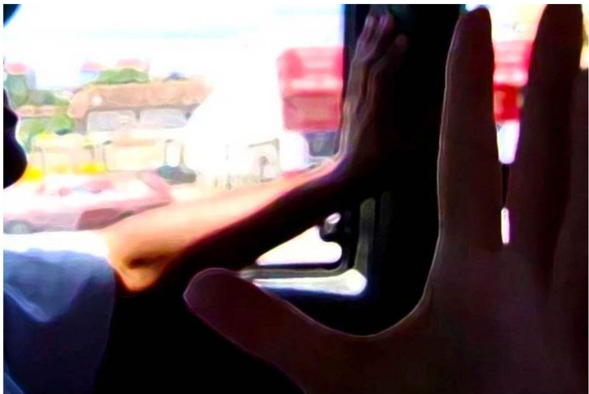
Imagem seleccionada de um vídeo gravado no caminho de volta da Rádio Comunitária da Lomba do Pinheiro