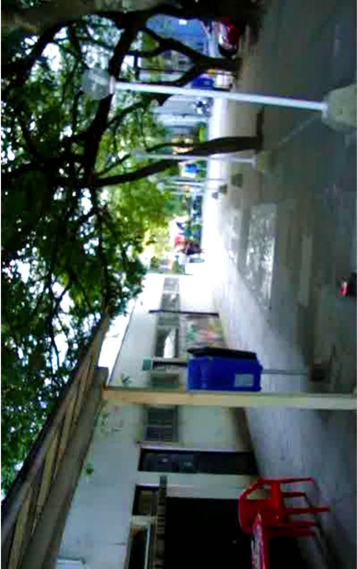
"A nossa UFRGS no caso, neste momento, fica e nós vamos, então fica a saudades" (Valdir diz, enquanto grava) Imagem selecionada de um vídeo feito em uma das reuniões do Coletivo de Rádio