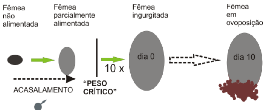
Figura 3. Esquema ilustrando a alimentação em Amblyomma hebraeum e o conceito de peso crítico definido por Harris & Kaufman [40]. Imagem adaptada de Friesen [PhD Thesis (2003), comunicação pessoal].

A transição entre as fases lenta e rápida de alimentação ocorre quando a fêmea atinge um aumento de 10 vezes no seu peso. Esse momento é bastante importante, pois marca o início das últimas 24 horas de alimentação e é conhecido como peso crítico (“critical weight” – CW; Figura 3) [40]. Esse momento é chamado de “crítico” porque as fêmeas