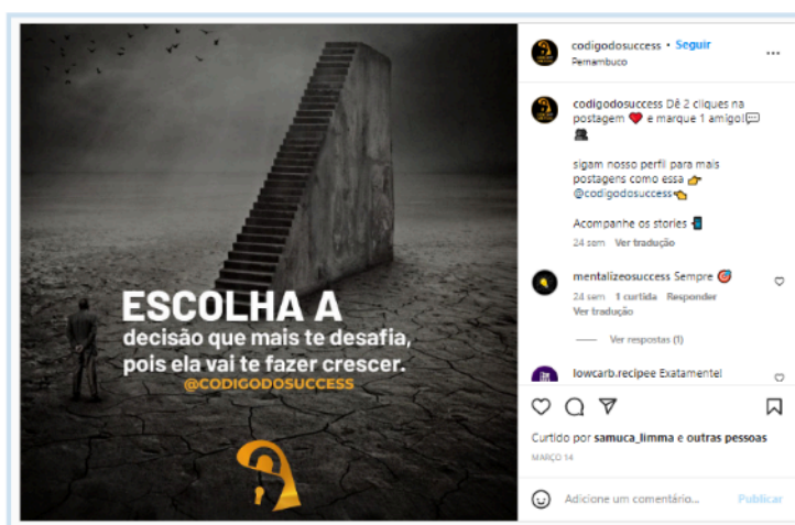
Figura 3 - Publicación del perfil codigodosuccess en Instagram