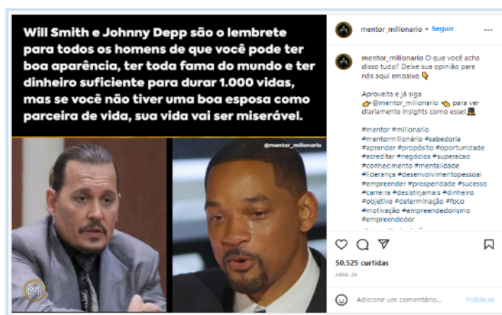
Figura 5 - Publicar el perfil de mentor_milionario en Instagram