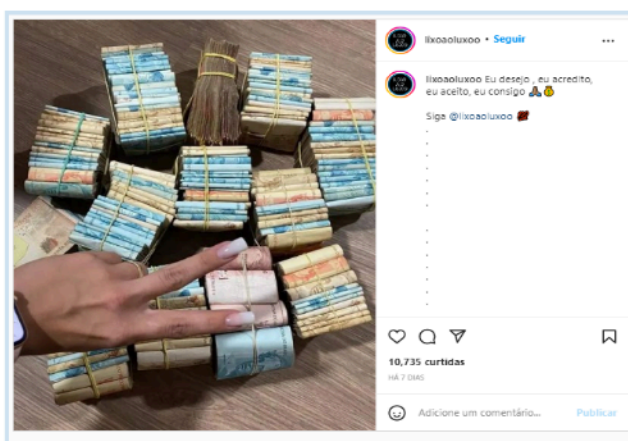
Figura 6 - Publicación del perfil lixoaoluxoo en Instagram