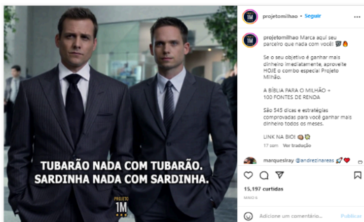
Figura 7 - Publicación del perfil de projectmilhao en Instagram