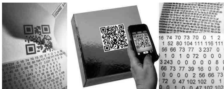
Figura 3 · Maria Lucia Cattani, Sete dias — one week, 2000.