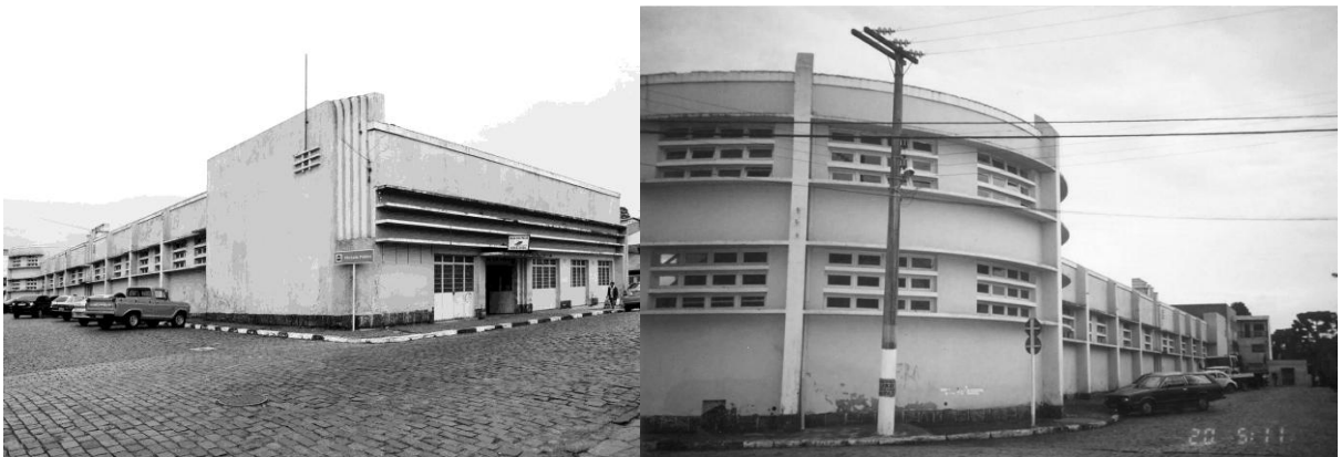
Figuras 2 e 3 - Fachadas do Mercado Público de Lages (n.d.).

Nas décadas de 1960 e 1970, o prédio passou por modificações. Uma cobertura foi construída entre o pavilhão principal e os blocos laterais, a fim de dobrar a sua área, o que poderia significar uma ampla procura pelos produtos ali comercializados. (FMCL, 2014).