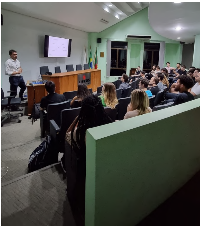
Aula Dr Eduardo Goelner.