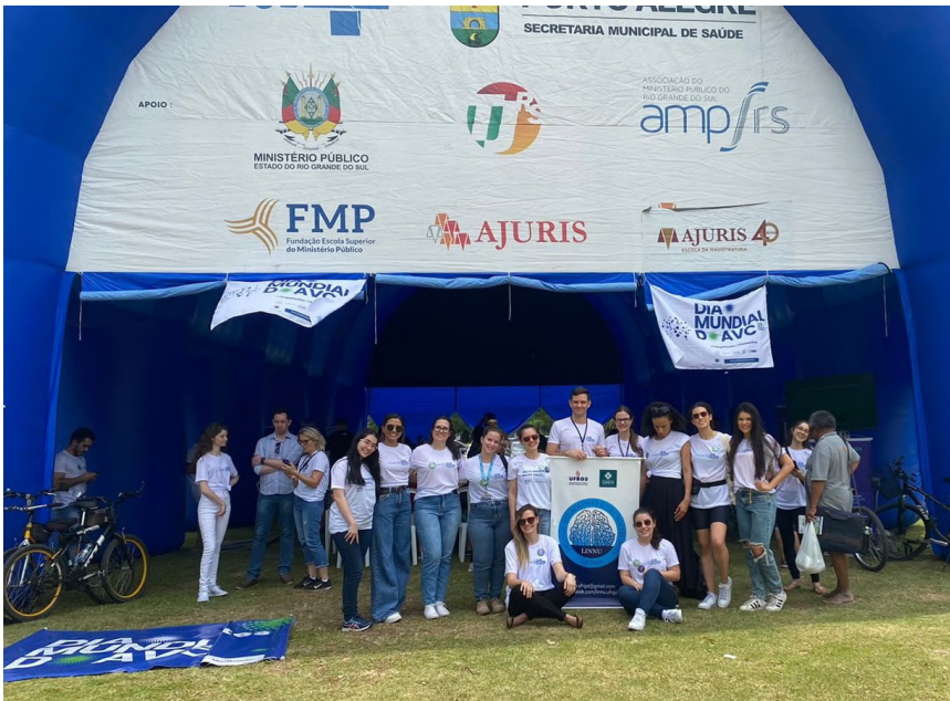
Dia mundial de combate ao AVC.