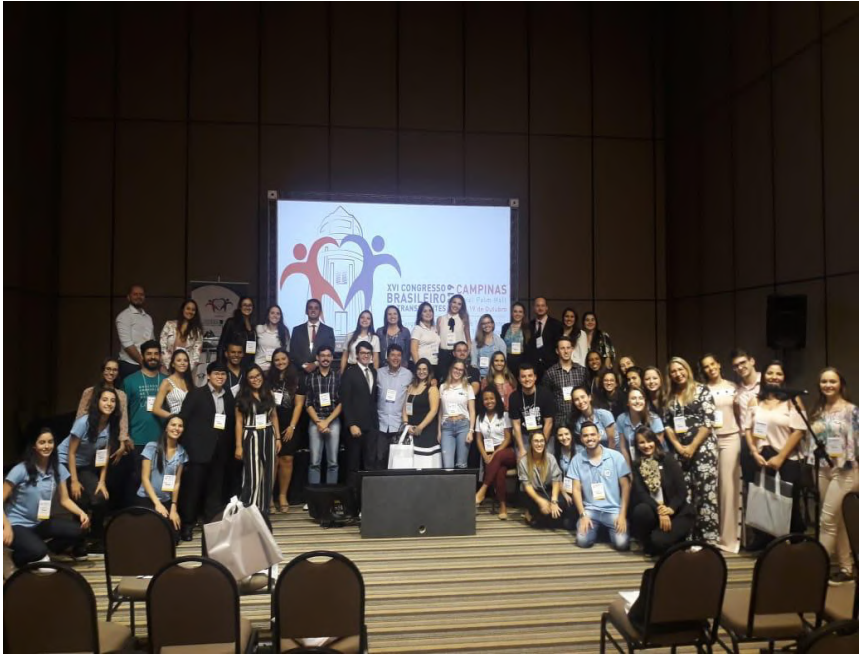
Congresso Brasileiro de Transplantes promovido pela ABTO 2019, em Campinas, com ligas de todo o Brasil.