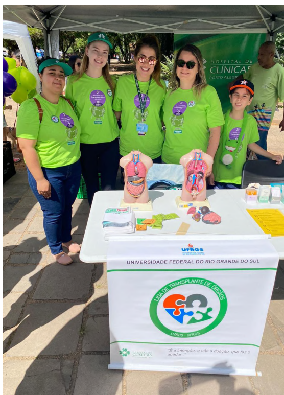
Caminhada dos Transplantados: 1ª edição e edição de 2023, evento que acontece no Parque Farroupilha(Redenção), Porto Alegre, em parceria com o HCPA.