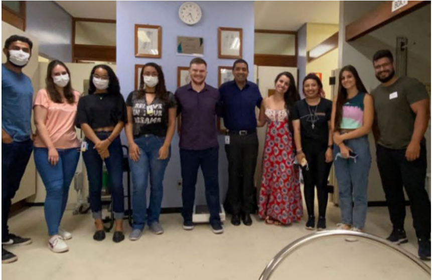
Primeira aula sobre lesões ortopédicas no esporte.