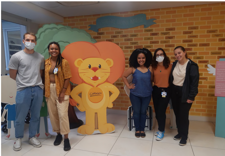
Visita ao Instituto de Câncer Infantil de Porto Alegre.