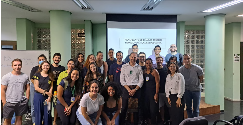
Aula sobre transplante de células tronco hematopoéticas em pediatria

espaço de aprendizado e colaboração, onde os alunos podem se especializar e desempenhar um papel ativo na luta contra o câncer, beneficiando tanto a comunidade acadêmica quanto a sociedade como um todo.