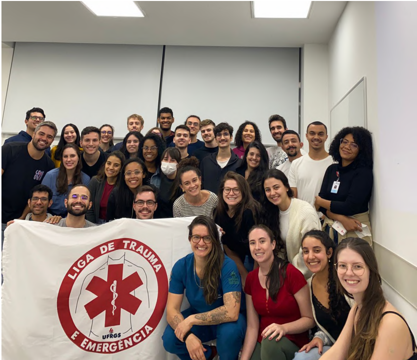
Ligantes LTE 2023.