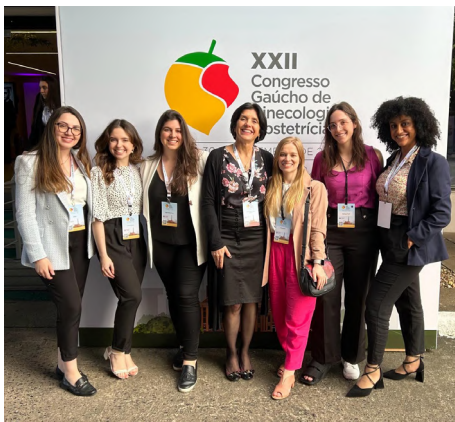
Participação do XXII Congresso Gaúcho de Ginecologia e Obstetrícia.

A participação na LiGO é uma experiência enriquecedora única que proporciona aos alunos a oportunidade de aprimoramento em Ginecologia e Obstetrícia, complementando as atividades curriculares e estimulando o interesse pela especialidade. Nesse projeto, os ligantes contribuem para a formação de outros acadêmicos por meio das monitorias, ao mesmo tempo que obtêm um crescimento pessoal por meio dessa e de outras atividades. Além disso, ao realizar ações na comunidade, promovem a saúde da mulher desde a atenção primária. Fazer parte da Liga de Ginecologia e Obstetrícia da UFRGS tornou-se um diferencial na qualificação da formação de futuros médicos.