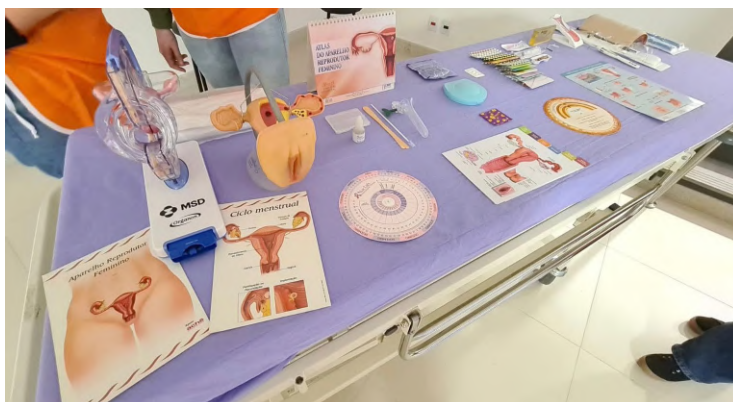
Exposição de materiais utilizados no UFRGS Portas Abertas, explicando sobre a especialidade de Ginecologia e Obstetrícia.