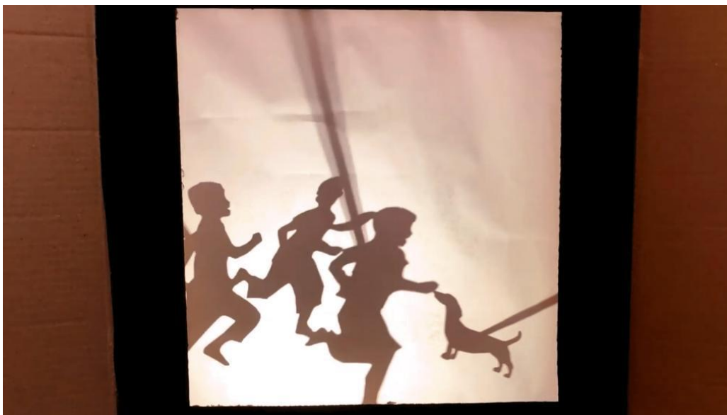
Figura 1: Imagem de cena do vídeo Hanna na Obra