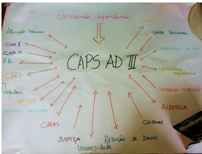
Figura 1. Rede AD na perspectiva da Equipe do CAPS AD III