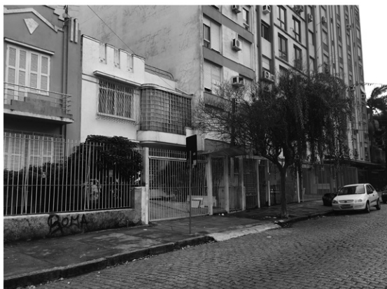
FIGURA 3 | Foto representativa do percurso 2: Rua Otávio Correia - Edificações com diferentes alinhamentos.