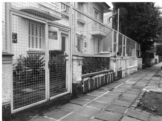
FIGURA 6 | Foto representativa do percurso 5: Rua José do Patrocínio – Edificações com diferentes alinhamentos.