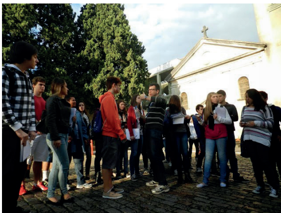
Figura 2 – Explicação e visualização do alto da colina da Oscar Pereira – visualização do Centro Histórico de Porto Alegre e o porquê da localização do cemitério onde está.

Após a contextualização inicial realizada, estudantes e professores dirigiram-se para a área externa do cemitério, ainda antes de ingressar no mesmo, para observação da cidade de Porto Alegre a partir da vista do que chamam “Colina da Saudade”, referindo-se ao pequeno morro existente no local. Destacou-se que o cemitério visitado está posicionado geograficamente em um local que, quando de sua construção (1850), era em um local afastado do que era a então Porto Alegre. O sítio urbano era afastado da cidade, pois não havia formas pontuais de controle dos dejetos da putrefação do corpo humano. Assim, construiu-se o cemitério afastado da cidade, para dar conta deste problema urbano. Explicou-se que, assim como o cemitério fora construído afastado do então núcleo urbano, outros equipamentos urbanos também foram edificados longe da cidade, como alguns hospitais, dentre eles o “leprosário” de Porto Alegre.