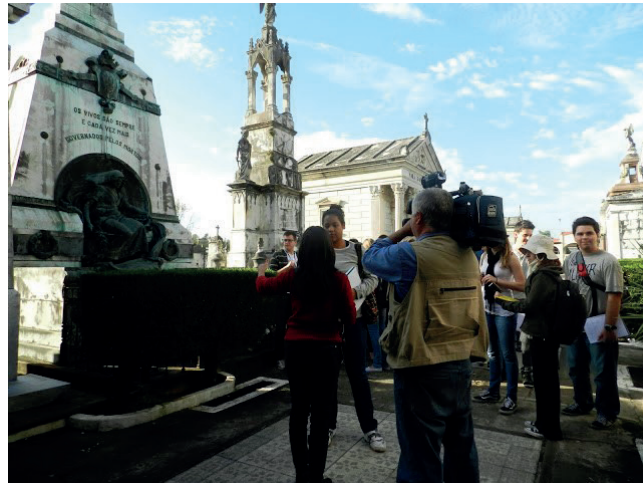
Figura 3 – Em frente ao túmulo de Júlio de Castilhos, cujo monumento possui relações com o monumento da Praça da Matriz.