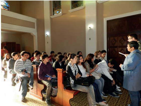
Figura 1 – Momento inicial da saída de campo, na capela do Cemitério.

no cemitério e oferecendo algumas pistas para que os alunos conseguissem realizar as relações que buscávamos, entre o ordenamento de um cemitério e as diferentes áreas urbanas. Também foi solicitada uma atividade de produção textual com título “Como eu penso em relacionar Geografia a um cemitério?” para que exercitassem a habilidade da escrita, relacionando com o tema.