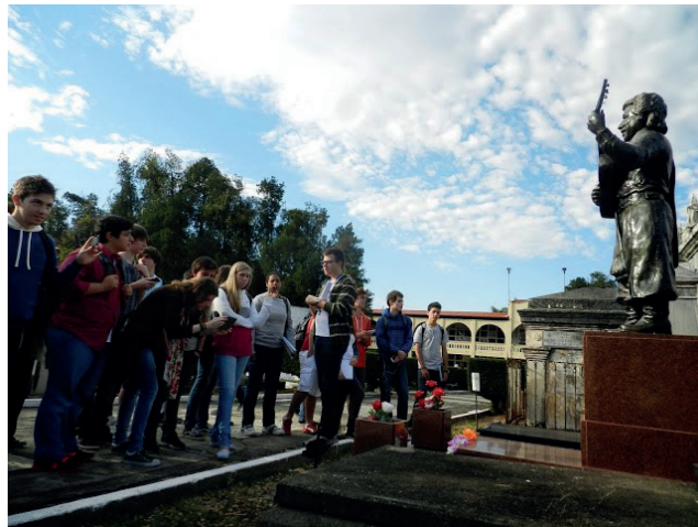
Figura 4 – Personalidades históricas – Vitor Mendes Teixeira (Teixeirinha).