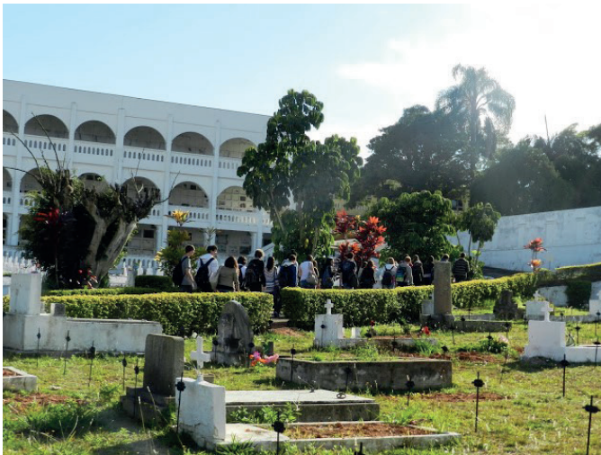
Figura 7 – Outra ala do cemitério – perda de valor econômico – relação com a especulação imobiliária.