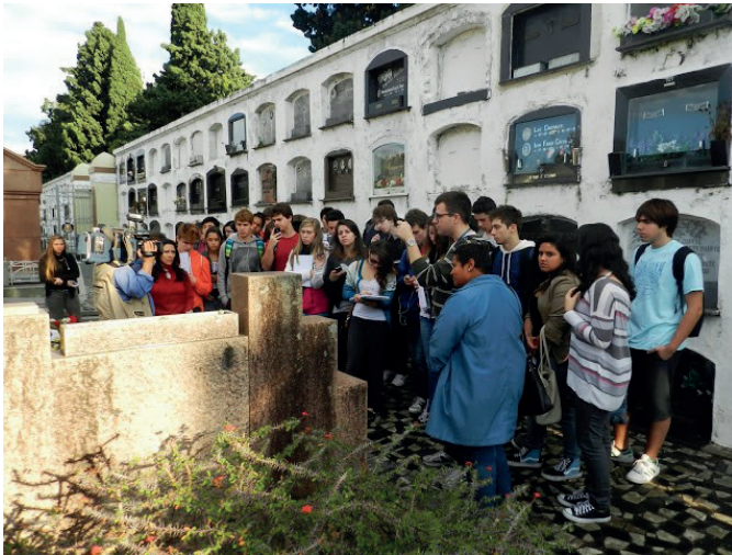
Figura 6 – Explicação sobre as relações entre o fenômeno da verticalização.