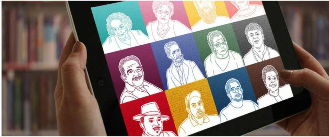
*Ilustração: Julia Silva

Everton Cardoso / 22 de agosto de 2024 / Carta aos leitores, Editoriais