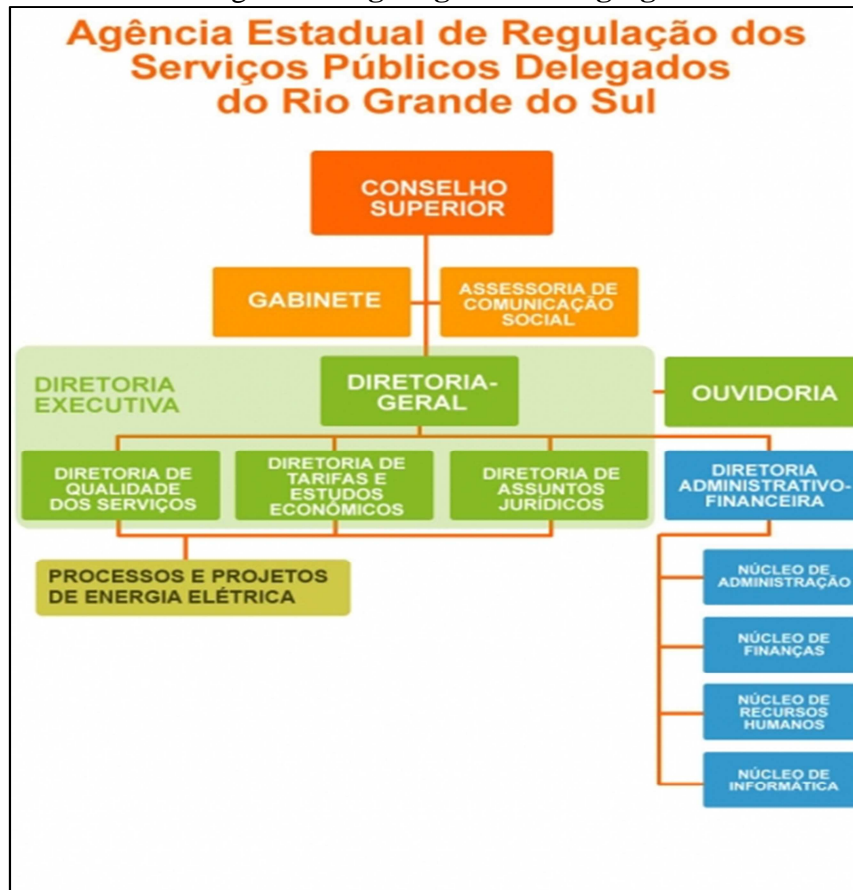
Figura 1: Organograma da Agergs