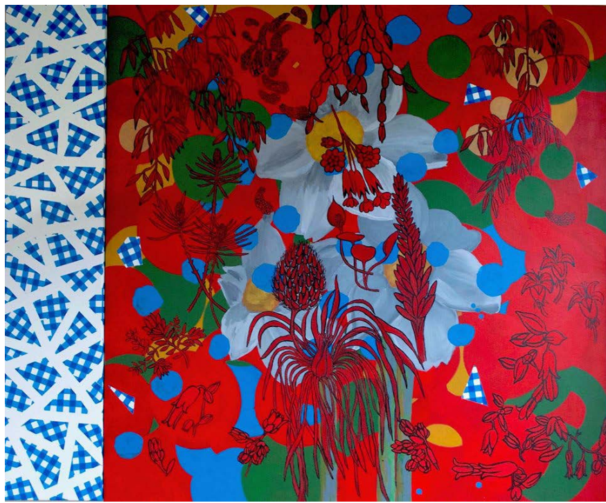
Figura 1 · Adriane Hernandez. Sem título , 2018. Tinta acrílica sobre tela. 120 x 100 cm. Fonte: própria da artista.