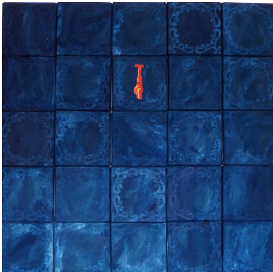
Figura 2 · Adriane Hernandez. Torneira , 1994. Tinta acrílica sobre tela. 100 x 100 cm.