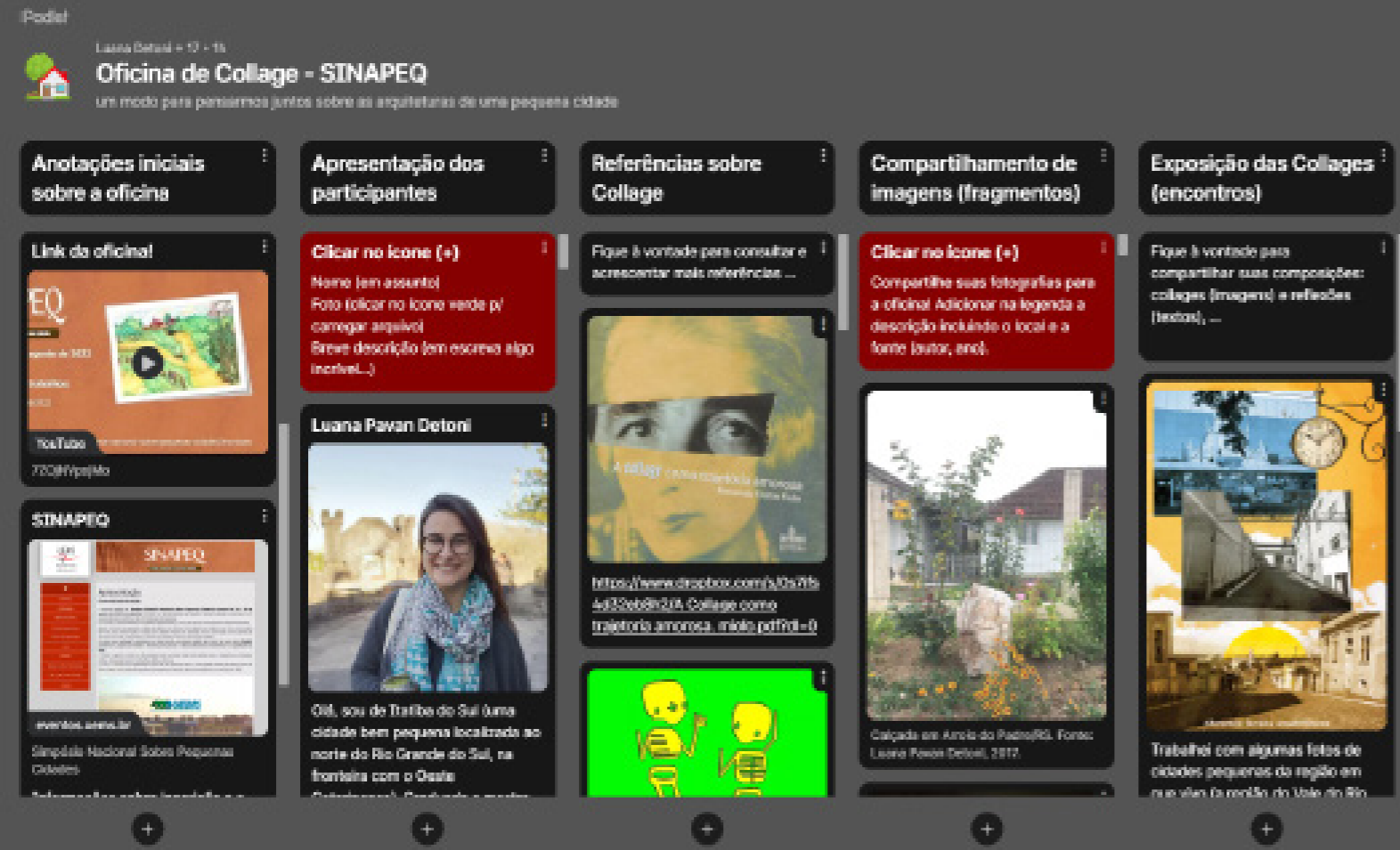
Figura 4 – Painel Padlet da Oficina de Collage.

Com base nesta organização foram estabelecidos os objetivos da oficina, realizada no VI SINAPEQ, que por sua vez orientaram os principais momentos da atividade: (i) Receber e acolher os participantes; (ii) Apresentar referências e abordagens para explorar a arquitetura por meio da técnica de collage; (iii) Estimular a reflexão sobre o papel da arquitetura nas cidades pequenas; (iv) Criar e compartilhar as collages produzidas, juntamente com o processo criativo e reflexões decorrentes.