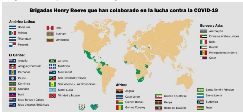
Imagem 1: Países que receberam as brigadas médicas cubanas até fevereiro de 2021