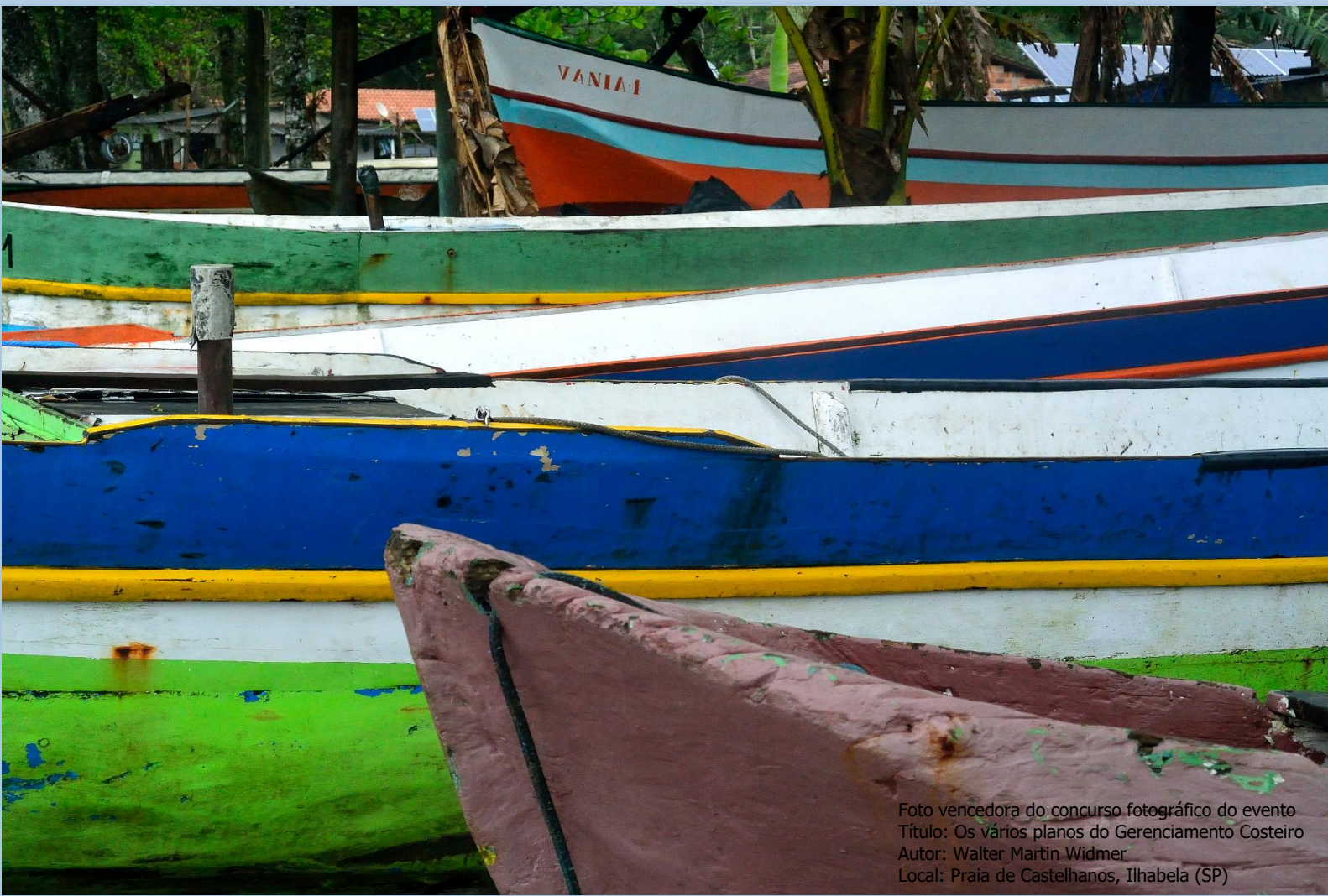
Foto vencedora do concurso fotográfico do evento Título: Os vários planos do Gerenciamento Costeiro Autor: Walter Martin Widmer Local: Praia de Castelhanos, Ithabela (SP)

De 04 de novembro a 14 de dezembro de 2021