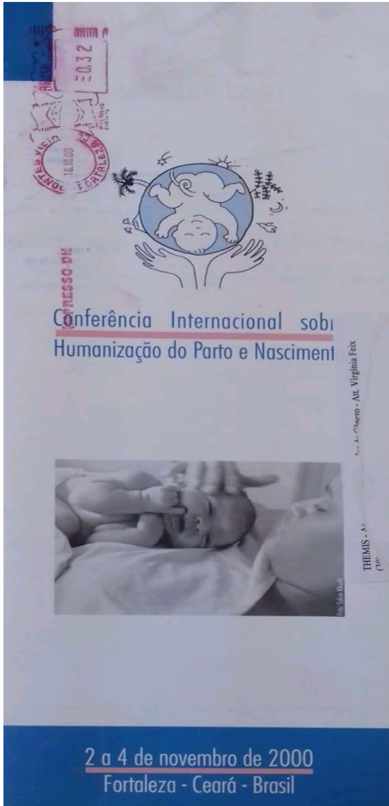
Figura 4: Capa do folder da Conferência Internacional sobre Humanização do Parto e Nascimento, 2000.