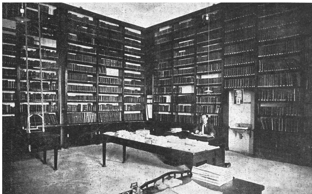
Década de 1920, na primeira sede da FAMED