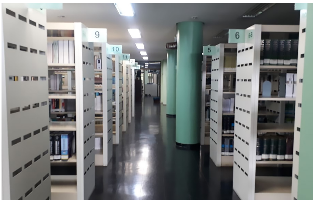
Década de 2020, na sede atual da FAMED