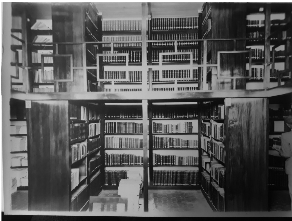
Década de 1940, na segunda sede da FAMED