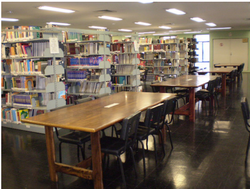
Década de 2000, na sede atual da FAMED