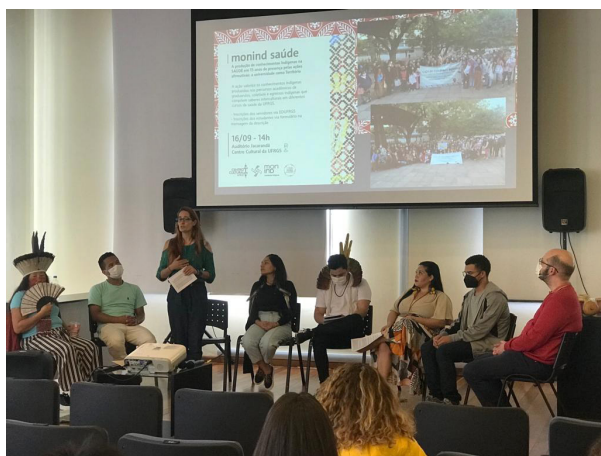
Evento MonIndi saúde, 2022