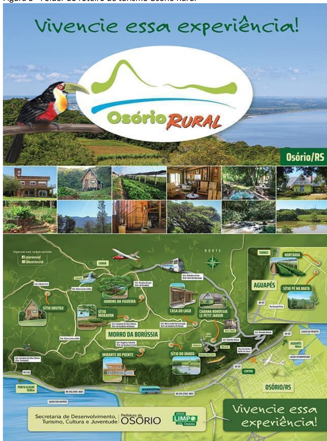
Figura 3 - Folder do roteiro de turismo Osório Rural

prefeitura. Entretanto, com intuito de se unir a esta iniciativa, a Prefeitura Municipal de Osório, entrou com o apoio institucional, e deu início à tramitação de um projeto de lei que instituisse o roteiro, já em processo de formação. Tendo como objetivo central, a consolidação de um roteiro de turismo rural, fez-se necessário uma ação mais bem planejada e com maior articulação entre os atores.