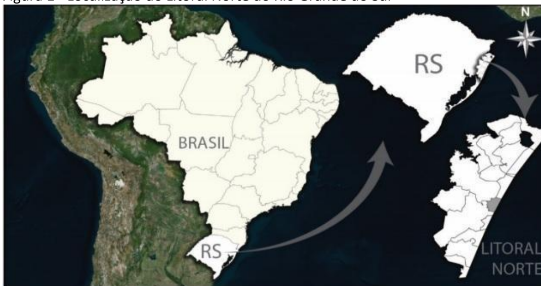
Figura 1 - Localização do Litoral Norte do Rio Grande do Sul